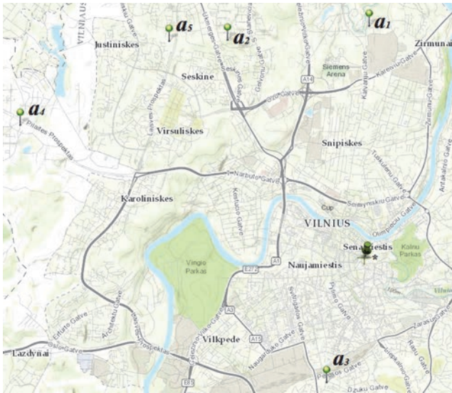
Slika 1. Lokacija nedovršenih projekata u Vilniusu (*središte grada)

vrijednost grada. Autori su procijenili vrijednost izgradnje i druge statističke podatke.