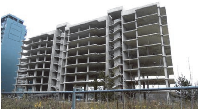
Slika 2. Projekt a_1