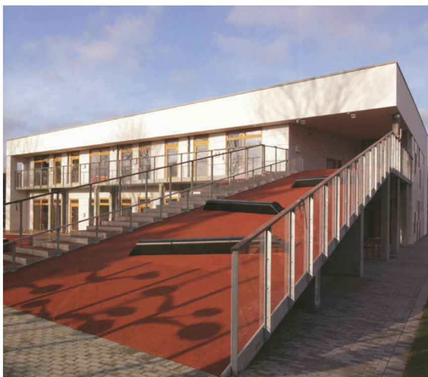
Dječji vrtić u Sanderumu, Danska

Krivulja tlaka pare pokazuje da pad temperature od približno 3,6 K (1 stu-