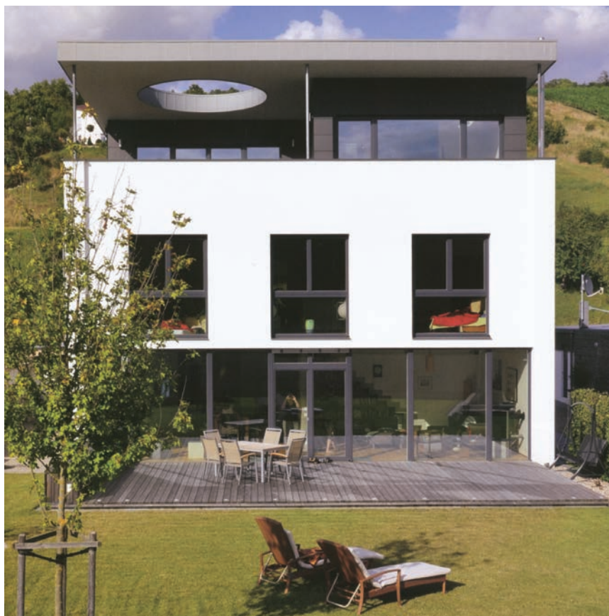
Obiteljska kuća u Weikersheimu u Njemačkoj

Kako vlaga dolazi na unutarnje površine? Relativno je lako pronaći "trivijalne"