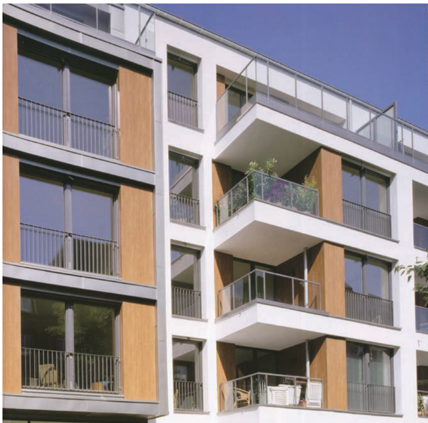
Dvije zgrade u Hamburgu građene prema principima pasivne kuće

izvora vlage, poput puknuća cijevi, praznine u komponentama zgrade, prepunjenih kada i pokvarenih strojeva za pranje rublja. Tada se problem može lako riješiti i šteta otkloniti tako da se više ne pojavljuje. Nasuprot tome, građevinski nedostaci, kao što su kapilarne veze s terenom (kada zgrada "usisava vlagu") i nedovoljna zaštita od kiše, zahtijevaju konstrukcijske promjene kako bi se mogla dodati odgovarajuća brtvila. Danas su dostupne različite mogućnosti, a problemi se obično mogu popraviti. Vlaga se, međutim, može također pronaći u unutrašnjem zraku, a potječe od ljudi, kuhanja, pranja i čišćenja, ali i od biljaka. Apsolutna je vlaga tako uvijek veća u zatvorenom nego u otvorenom prostoru (osim kad postoji aktivno odvlaživanje). Postotci izmjene unutrašnjeg i vanjskog zraka općenito se povećavaju kako bi se smanjila unutrašnja vlažnost, a proces je učinkovitiji što je hladniji vanjski zrak. Određena je količina vanjskog zraka također po-