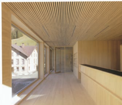
Kulturni centar u St. Germaldu u Austriji

korisnika. Koncentracija čestica prašine iz vanjskog zraka smanjena je još više. Filtri svježeg zraka preporučeni za ventilacijske sustave pasivne kuće filtriraju 90-95 posto prašine s kritičkim promjerom 0,4 mm – što je očito poboljšanje za osobe s astmom.