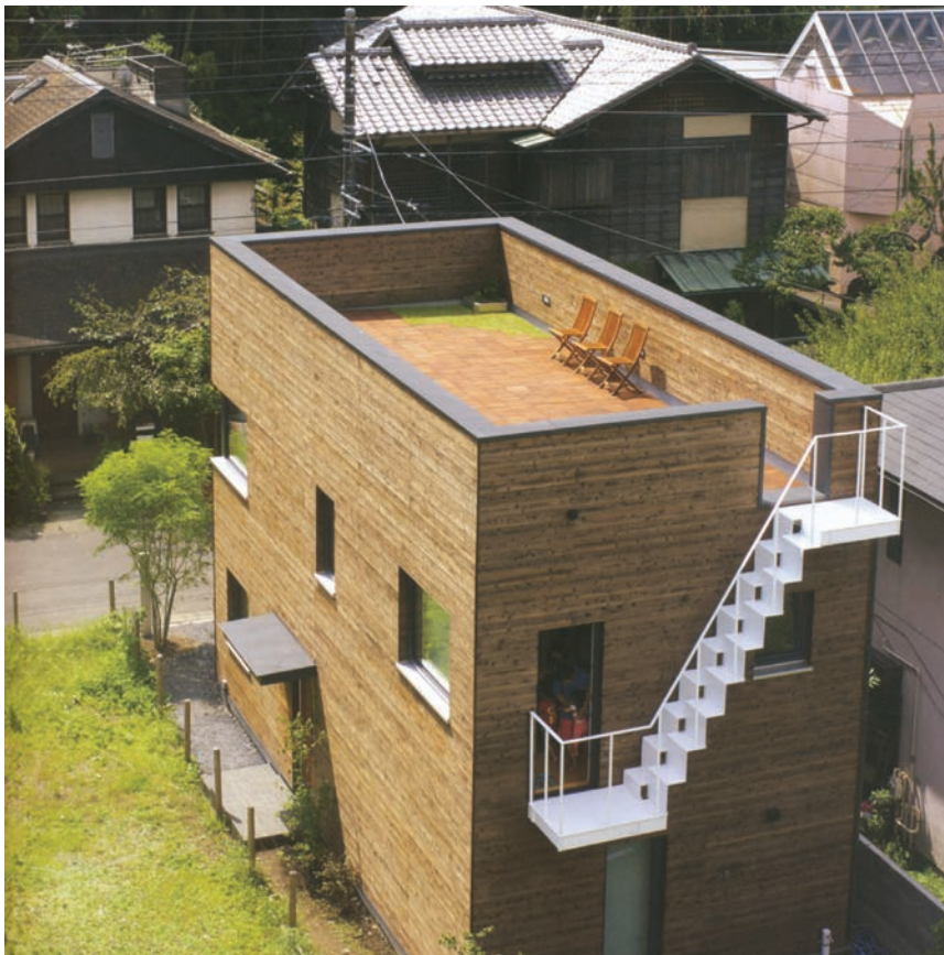
Nagrađivana obiteljska kuća u Kamakuri u Japanu

Komponente za ovojnicu građevine imaju sve duže trajanje. Graditelji su naučeni da se pročelja, prozori i krovovi ne trebaju obnavljati desetljećima,