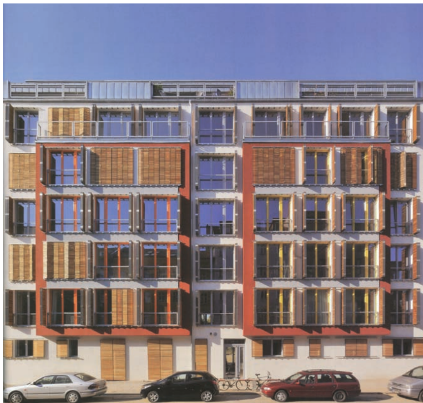
Višestambena zgrada u središtu Berlina

Zašto je prekomjerno suh zrak u stano- vima s ventilacijskim sustavima? Izmjena svježega zraka na približno 25 m 3 /h po osobi jedva je dovoljna da se smanji širok spektar unutarnjega zračnog opterećenja (ovisno o dnevnom prosjeku).