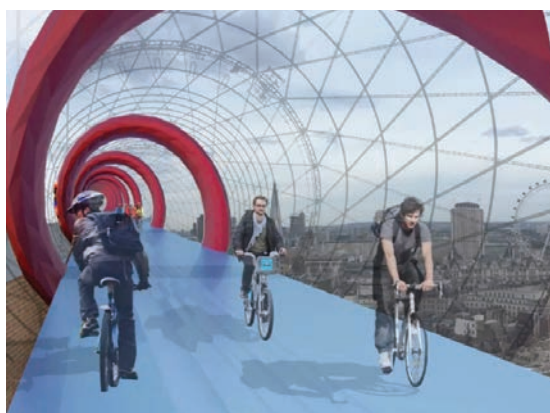
Prijedlog rješenja biciklističke cijevi

pronalaženju prostora u prometnom i zagušenom gradu, izjavio je Norman Foster koji je ujedno i strastveni biciklist te predsjednik udruge National Byway Trust za promociju biciklizma. Primjenom koridora iznad prigradske željeznice može se stvoriti mreža sigurnih biciklističkih staza bez automobila. Ako se planovi odobre, cijeli bi se projekt mogao etapno realizirati u sljedećih 20 godina, a znatno bi pridonio poboljšanju cjelokupne prometne mreže koja je već na granici "pucanja". Pritom treba računati i s očekivanim porastom populacije od 12 posto u desetljeću što slijedi, a provedena istraživanja dokazuju da su gradovi u kojima se može hodati ili voziti bicikl mnogo ugodniji za život. Poboljšanje kvalitete života u Londonu i poticanje novih generacija biciklista nije moguće bez potrebne sigurnosti kretanja po gradu. Međutim, najveća je prepreka odvajanju automobila i biciklista fizičko ograničenje londonskih ulica na kojima je prostor već potpuno iskorišten. Prema projektantima, gradnja bi povišenih staza bila znatno jeftinija od