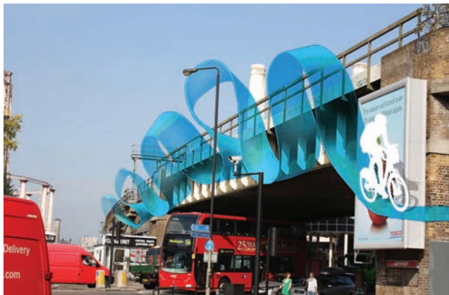
Nova biciklistička staza iz pješačke vizure