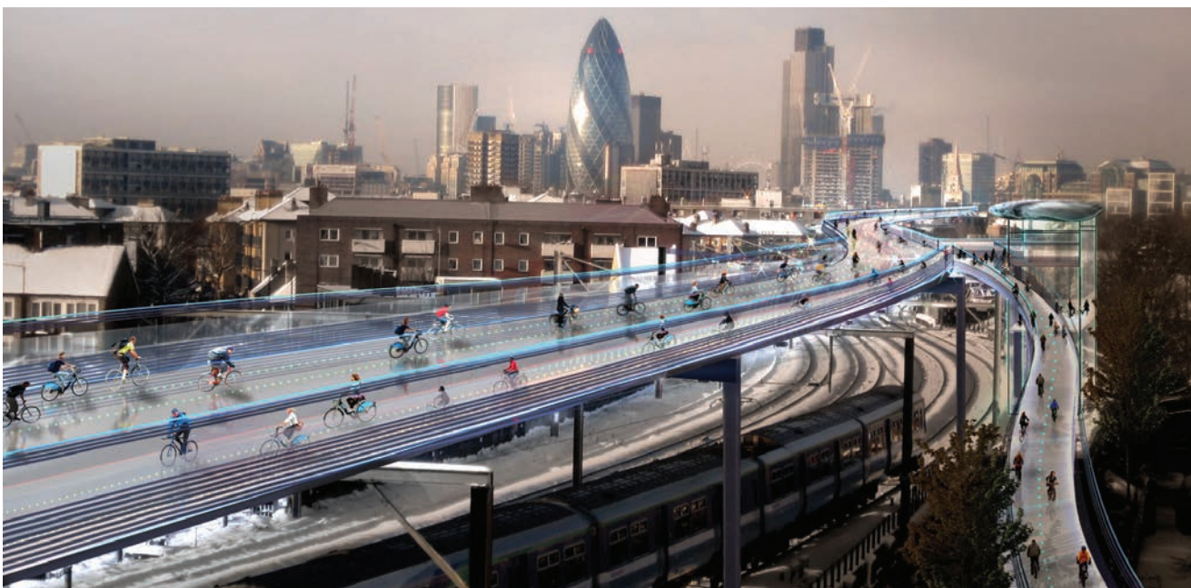
Planirana biciklistička staza iznad londonske željeznice

biciklističkih staza koje bi pratile trase postojećih željezničkih linija. Više od 200 ulaznih mjesta širom engleske prijestolnice osiguralo bi pristup na deset različitih biciklističkih staza. Svaka bi staza mogla primiti i do 12.000 biciklista na sat i ujedno, ovisno o ruti, i do pola sata skratiti vrijeme putovanja po gradu. Projekt je zapravo drugačiji pristup