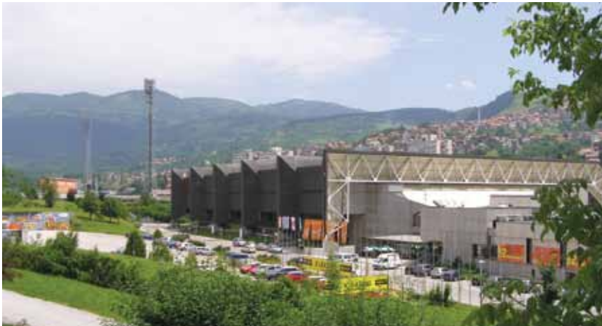
Obnovljena dvorana Zetra

i njezino ime ( Zetra je kratica od Zelena magistrala ) koje je nadjenuto zato što je dio grada u kojem se nalazi namijenjeno sportu i rekreaciji odnosno asocira na strujanje zraka od Nahoreva i Betanije preko zelenih površina i niz Koševski potok . Međutim tu su kraticu oni koji su opsjedali Sarajevo tumačili kao muslimansko povezivanje od Sara-