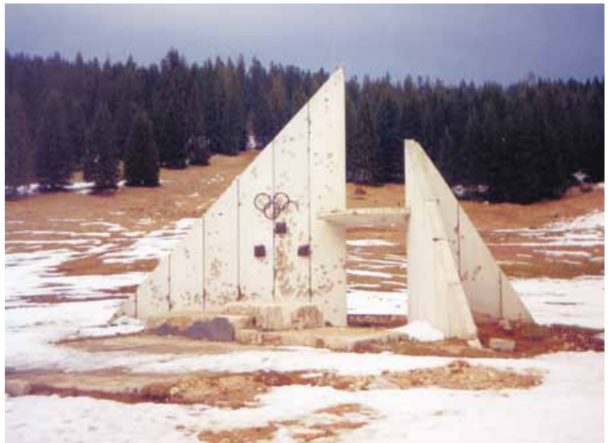
Uništeni olimpijski simboli na skijalištima pokraj Sarajeva

Primijenjena su nova konstruktorska rješenja pa se smatra da su to za skakače bile skakaonice među težima u svijetu. Doskočišta su im ukopana, što je inače rijetkost u izvođenju takvih sportskih građevina, ali to je učinjeno zbog potrebnog nagiba od 20 stupnjeva. Betonska je konstrukcija građena s