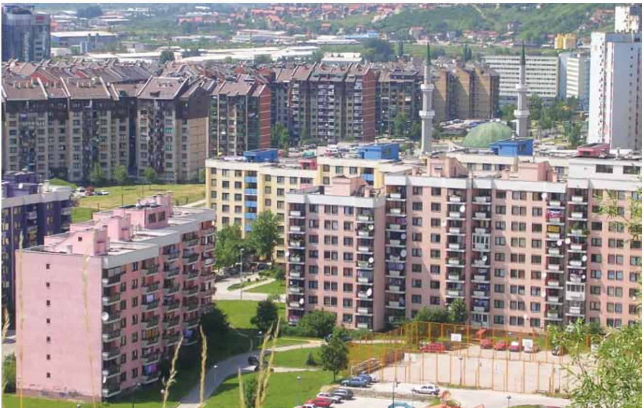
Obnovljeno stambeno naselje Mojmilo , negdašnje olimpijsko selo

U Sarajevu inače djeluje poduzeće ZOI'84 Olimpijski centar Sarajevo d.o.o. koje je pravni sljednik Organizacijskog komiteta XIV. zimskih olimpijskih igara i zapošljava 130 djelatnika, u svom sastavu ima skijaški centar na Bjelašnici i Igmanu , Olimpijski kompleks Zetra i ZOI Tours , turističku agenciju s hotelima, poslovnim turizmom i sportom kao glavnim aktivnostima. Danas je to kantonalno javno poduzeće koje nastoji oživjeti olimpijski duh i osigurati nužne uvjete za organizaciju novih olimpijskih igara u Sarajevu.