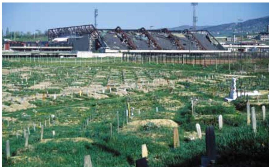
Groblje pokraj dvorane Zetra snimljeno 1995.