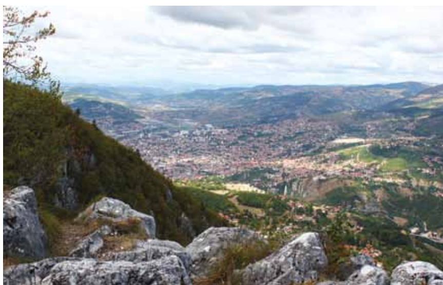
Pogled na današnje Sarajevo s Trebavića