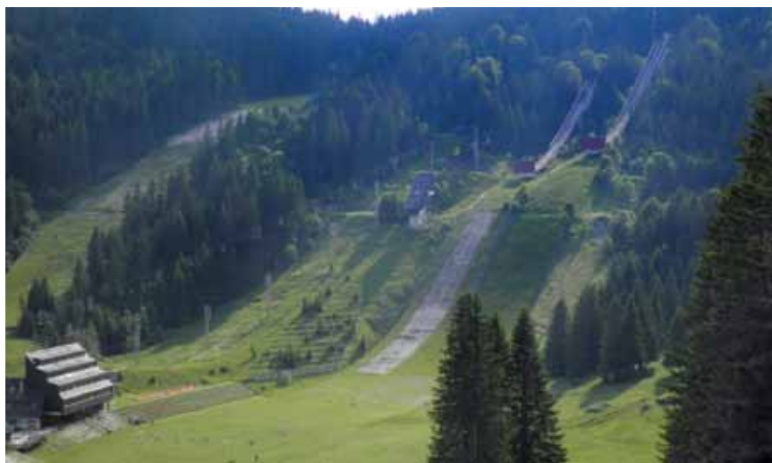
Skakaonice su već dugo izvan uporabe

Najteže je stradala Zetra koja je izgorjela nakon što je pogođena brojnim zapaljivim bombama u početku opsade 21. svibnja 1992. Jedno je od opravdanja za njezino neprestano raketiranje bilo