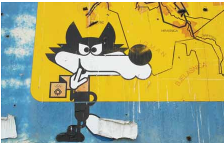
Maskota Vučko još i sad se može pronaći na nekom izbljednem plakatu

Podatke o dvorani Zetra kojoj je posvećen poseban tekst zasad preskačemo. Bio je gotovo potpuno preuređen obližnji stadion Koševo i osposobljen za održavanje najvećih sportskih priredaba, a na njemu su održane i svečanosti otvaranja (olimpijski je plamen zapalila