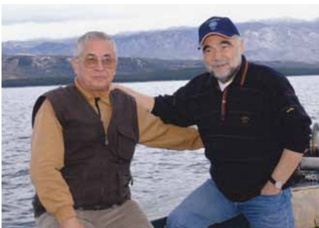
Na ribolovu sa Stipom Mesićem

Drugi je događaj bio povezan s dr. Franjom Tuđmanom, prvim predsjednikom samostalne Hrvatske, a zbio se nakon osamostaljenja Hrvatske i u doba zamjetne međunarodne izolacije. Naime Ingra je 1988. bila obnovila kazalište u mađarskom gradu Kapošvaru, a posao je dobila zahvaljujući prije toga izvedenoj obnovi i adaptaciji zgrade Hrvatskoga narodnog kazališta u Varaždinu. Dobro obavljen posao u Kapošvaru potaknuo je i obnovu kazališta Szigligeti u gradu Szolniku u središnjoj Mađarskoj. Za svečano je otvorenje mađarski predsjednik Antal Göncz (koji inače ima međimurske odnosno čakovečke korijene) pozvao dr. Franju Tuđmana kojemu je to bio prvi državnički posjet. Tada je predsjednik Göncz vrlo lijepo govorio o Međimurcima i Hrvatima. Dr. Režek bio je osobito ponosan što je kao diplomirani mostograditelj bez mostova uspijevao eto i u poslu i životu graditi mostove povjerenje i prijateljstva.