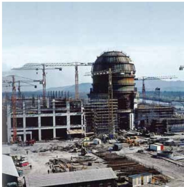
Gradilište NE Krško

vak studija. No zahvaljujući ondašnjemu hrvatskom ministarstvu znanosti ipak je dobio novu stipendiju koja mu je omogućila završetak studija. Taj nazgled mali, ali i životno važan događaj, najvjerojatnije ga je zauvijek vezao za Zagreb i Hrvatsku. Navodno su ga često zvali u Crnu Goru, nakon osamostaljenja i u Ministarstvo građevinarstva, ali je svaku takvu ponudu odbijao. Diplomirao je 26. ožujka 1959. i odmah