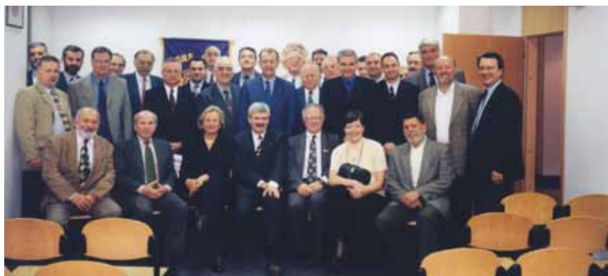
Zajednički snimak djelatnika Ingre

gućili Ingre sudjelovanje na velikim međunarodnim licitacijama za projekte što ih je financirala Međunarodna banka za obnovu i razvoj. Gradile su se i velike petrokemijske i poslovne građevine u ondašnjoj Čehoslovačkoj, turistički i bolnički kompleksi u SSSR-u odnosno Rusiji, pa je Ingra bila na gradilištima u Njemačkoj, Egiptu, Iraku, Iranu, Sudanu, Etiopiji, Alžiru, Brazilu, Argentini, Kini, Kostarici, Kubi i sl., a bila je uključena i u najsloženije poslove u Hrvatskoj.