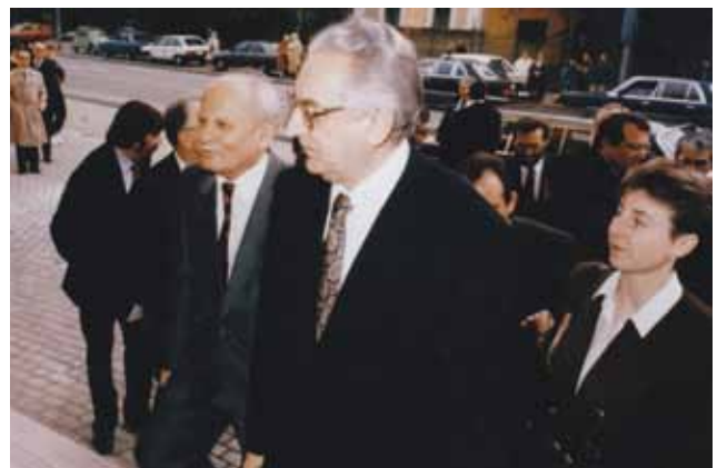
Dr. Franjo Tuđman i mađarski predsjednik Antal Göncz na otvaranju kazališta u Szolniku