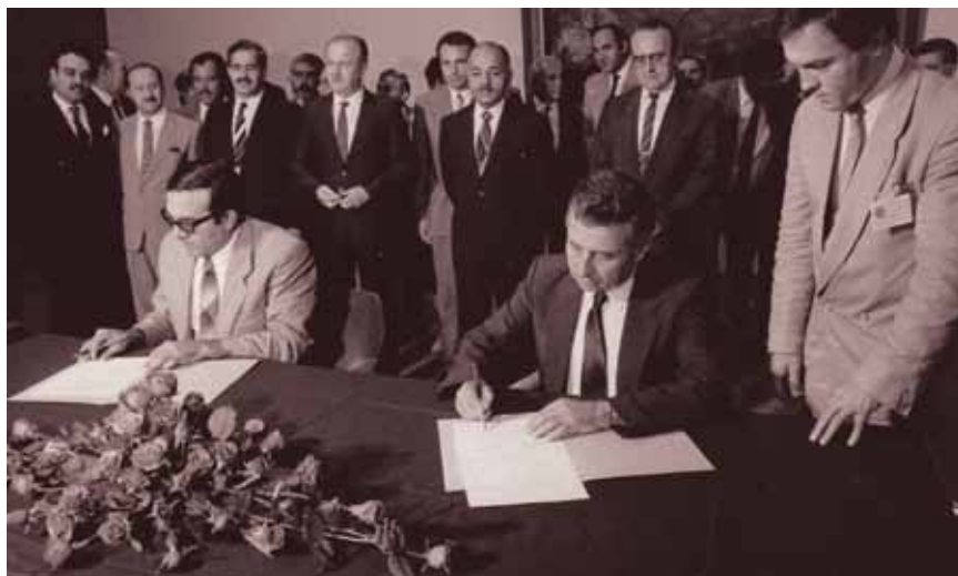
Potpisivanje ugovora za gradnju HE Bekhme

tvaranja Ingre u suvremenu kompaniju nakon osamostaljivanja Hrvatske kada je i postao predsjednik Uprave Ingre d.d.