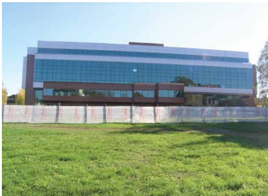
Obnovljeno glavno pročelje zgrade PIK-a Vinkovci