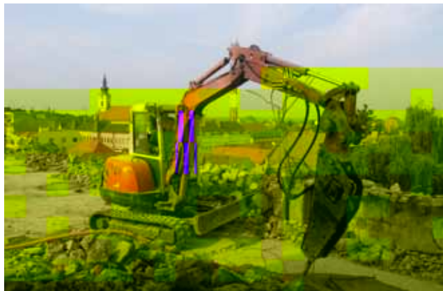
Bager s pneumatskim čekićem na krovu zgrade