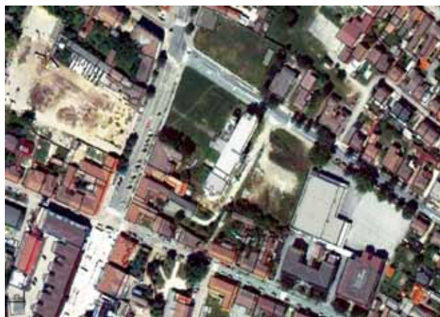
Pogled iz zraka na središte Vinkovaca i zgradu PIK-a Vinkovci (u sredini)