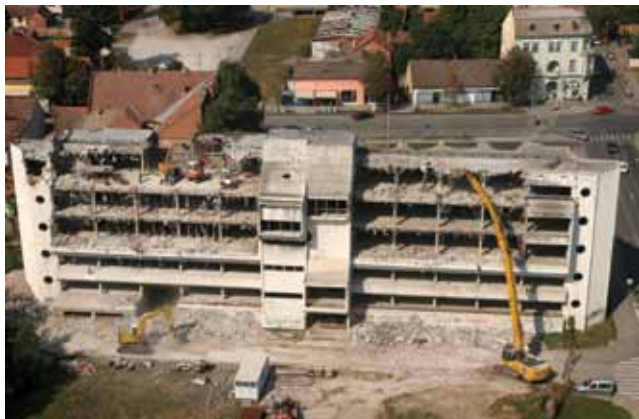
Rušenje dijelova konstrukcije