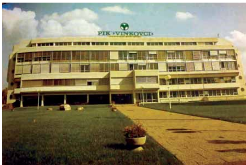
Jedna od rijetkih slika izvornog izgleda zgrade

Upravna zgrada PIK Vinkovci ima sve stilske značajke opusa arhitekta Duška