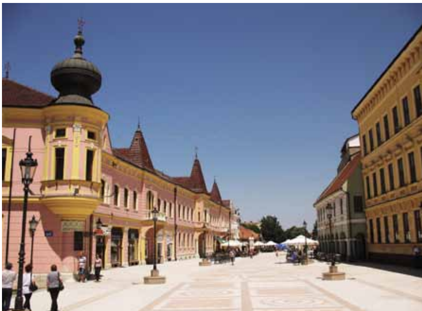
Središte Vinkovaca (lijevo zgrada Brodske imovne općine)

Na kraju smo posjetili i investitora – Hrvatske šume d.o.o., Upravu šuma Podružnica Vinkovci, koja je smještena u središtu Vinkovaca, na Trgu bana Šokčevića 20, u zgradi negdašnje Brodske imovne općine. Ta je golema i lijepa zgrada nastala neobaroknom i neorenesansnom restauracijom zgrade uredovnice odnosno direkcije šuma Brodske imovne općine te dogradnjom neogotičkog dijela u Ulici kralja Zvonimira. Malo je poznato da je ta reprezentativna zgrada građena od 1909. do 1912. (konačan je oblik dobila 1916.) prema projektu slavnog Hermana Bolléa. Iznad ulaznih vrata su reljefni ukrasi sa simbolima šuma i šumarstva ovoga kraja, a na zgradi je i spomen-ploča Josipu Runjaninu, skladatelju hrvatske nacionalne himne. Bila je teško oštećena u Domovinskom ratu, a obnovile su je Hrvatske šume .