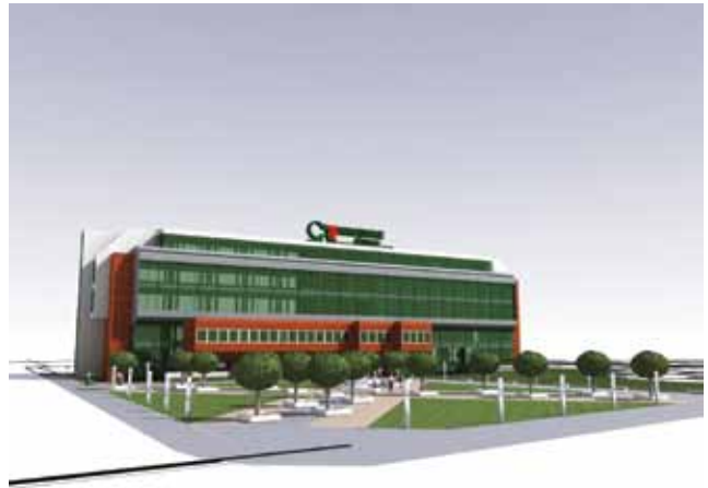
Prikaz budućeg izgleda zgrade s pročelja

mjereno izolirati i zaštititi, a svi su prostori na katovima namijenjeni uredima, ordinacijama i sl.