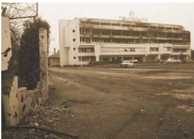
Zgrada PIK-a Vinkovci odmah nakon požara

Duško Rakić rođen je 1932. u Šibeniku i autor je tridesetak izvedenih građevina u Hrvatskoj i u mnogim krajevima bivše Jugoslavije. Sudjelovao je na četrdesetak javnih natječaja na kojima je često pobjeđivao. Nakon umirovljenja 1991. bio je predavač povijesti arhitekture na likovnim akademijama u Zagrebu i Širokom Brijegu te povijesti graditeljstva na Prirodoslovno-matematičkom fakultetu. Za svoja je predavanja napisao opsežan udžbenik Opća povijest arhitekture – od pra-arhitekture do anti-arhitekture , tiskan 2005. Dobitnik je nagrade Viktor Kovačić za životno djelo