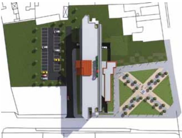
Prikaz budućega izgleda iz zraka