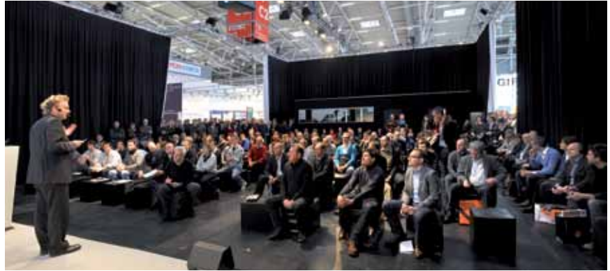
Novinska konferencija povodom siječanjskog sajma Bau

ili hlađenje građevina. Stoga je već godinama energetska učinkovitost glavni sadržaj svih rasprava. Na sajmu će se predavanjima i posebnim predstavljajima pokušati prikazati kako će se u budućnosti opskrbljivati energijom građevine i urbanističke cjeline te kakva će ih tehnološka unapređenja pratiti.