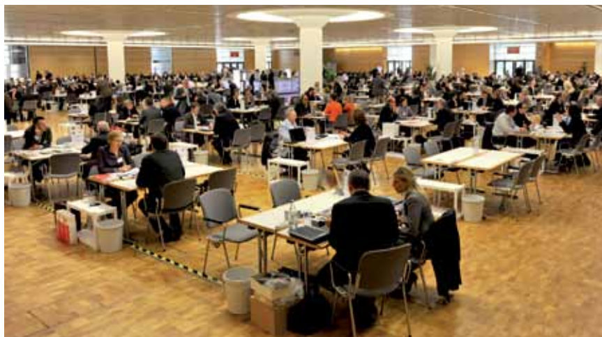
Razgovori novinara koji preta graditeljstvo s izlagačima Bau 2013 na Münchenskom sajmu u listopadu 2012.

U odnosu na suvremenu uporabu energije valja reći da sada u Europi gotovo 40 % utrošene energije odlazi na grijanje