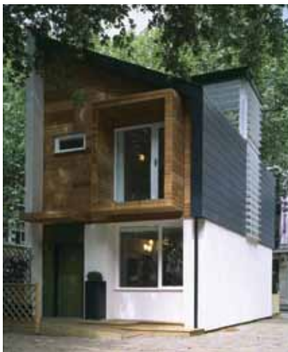
Pasivna kuća s drvenim elementima u Njemačkoj kraj Frankfurta

Dosljednim projektiranjem i izvedbom pasivne kuće vrlo su male potrebe za dodatnom toplinom za grijanje. Godišnja potrošnja energije za grijanje ne smije prelaziti 15 kWh/m 2 a, što od-