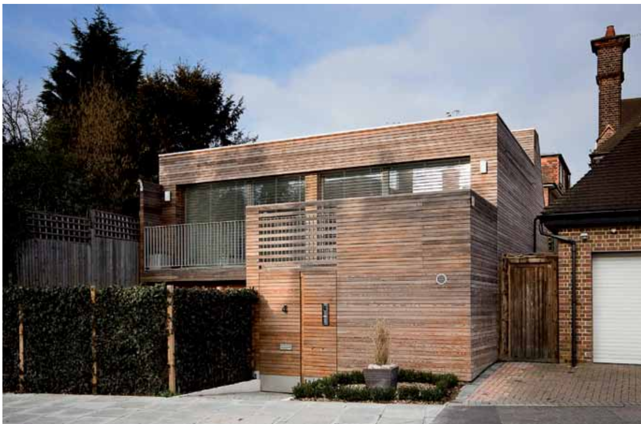
Drvena pasivna kuća u Camden, New Jersey

drvenim građivima. Za pasivne se kuće od drva najviše upotrebljavaju sustavi stupova i gređa, sustavi baloon frame (lagani, prozirni okvir), konstrukcije od masivnog drva, šuplji elementi od troslojnih ploča te nosivi elementi drvene okvirne konstrukcije. Između nosivih dijelova drvene konstrukcije obično se ugrađuje toplinska izolacija od različitih materijala, ali je s obzirom na visoku ekološku vrijednost drva najprimjerenija uporaba prirodnih toplinskih izolacija. Među njima su najčešće izolacije od drvenih vlakana i celuloznih komadića, a mogu se upotrijebiti i one od mineralnih i sintetičkih materijala. Lagane se konstrukcije mogu izrađivati u tvornici u obliku zidnih elemenata u cijelosti sastavljati na gradilištu.