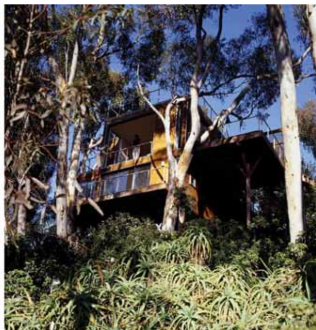
Kuća na drvu izgrađena sa svim elementima pasivne kuće, Australija