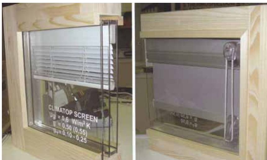
Drveni prozor s trostrukim ostakljenjem i elementima zaštite od sunca

Za postizanje što manjih toplinskih gubitaka od prozračivanja, u pasivnoj je kući obavezan sustav kontroliranog prozračivanja s vraćanjem topline otpadnog zraka. Svježiji se vanjski zrak zahvaća izvan građevine i dovodi do uređaja za prozračivanje. Prije ulaska filter zadržava dijelove prašine. U prijenosniku topline (rekuperatoru) svježiji se