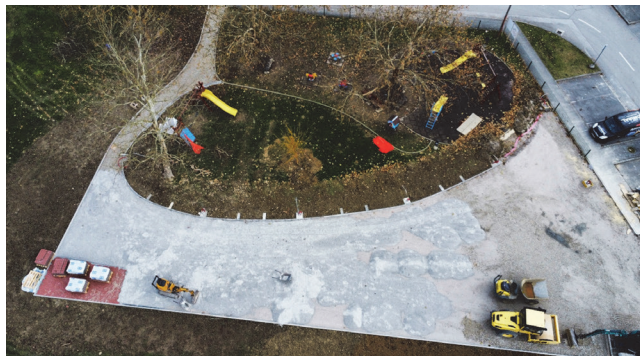
Pilot-lokacija na Trgu dr. Franje Tuđmana u Klinča Selima