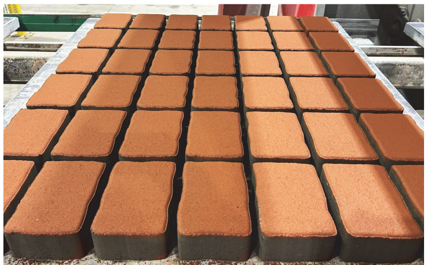
Proizvodnja inovativnih pločnika

Općina Klinča Sela izabrana je na javnome pozivu kao pilot-lokacija za