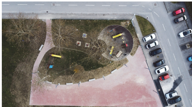
Trg dr. Franje Tuđmana s ugrađenim AshCycle proizvodima