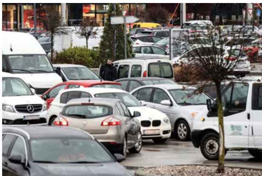
Prometne gužve postale su svakodnevnica, a pronalazak slobodnog parkirnog mjesta lutrija

pristup i dugoročnu strategiju. Boljom organizacijom i znatnijim ulaganjima u javni prijevoz moglo bi se smanjiti oslanjanje na osobne automobile i tako ublažiti pritisak na parkirališne kapacitete. Pogledajmo kako to danas izgleda na primjeru glavnoga grada Hrvatske. Već desetljećima razmatraju se rješenja poput lake gradske željeznice i metroa, no ona ostaju samo na razini ideja, dok se problem parkiranja i prometnih gužvi iz godine u godinu pogoršava. Na zagrebačkim cestama posljednjih godina vlada velika gužva, a parkiranje u mnogim dijelovima grada pretvara se u pravu lutriju. U pojedinim četvrtima vozači na traženje parkinga potroše više od 30 minuta jer ga ne mogu pronaći u blizini svojega stana.