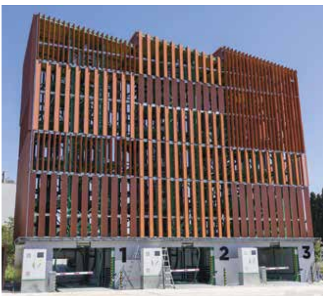
Pogled na rotirajuću garažu u Puli

Pulska rotirajuća garaža visoka je 14,5, široka 17,5 a duboka 7,5 metara te može primiti automobile do dva metra visine i 2,5 tone težine. Sustav upotrebljava motor snage od samo 9,2 kW, što osigurava minimalnu potrošnju energije. Ulazak i izlazak vozila regulirani su rampama i senzorima za očitavanje registarskih oznaka. Cijena parkiranja iznosi 1 euro tijekom zimskih mjeseci te 1,6 eura u ljetnoj sezoni. Glavni projektant Ivan Markić, dipl. ing. građ., je pri