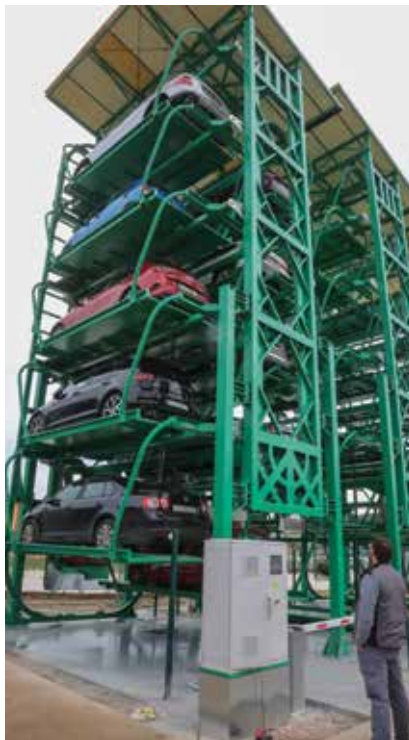
Rotacijski sustav parkiranja

zbog dugotrajne upotrebe. Posebna pozornost posvećuje se i očuvanju završne zaštite konstrukcije pa će se po potrebi sanirati eventualna oštećenja boje kako bi se spriječila korozija i osigurala dugotrajna otpornost na vremenske uvjete.