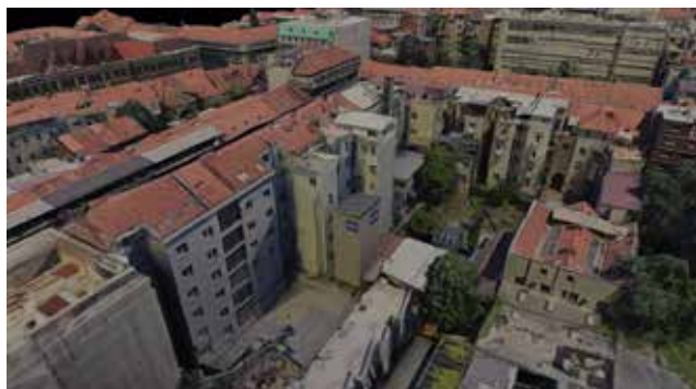
Vizualizacije rotirajućih garaža – primjeri za grad Split - Plokite i Zagreb - Armuševa