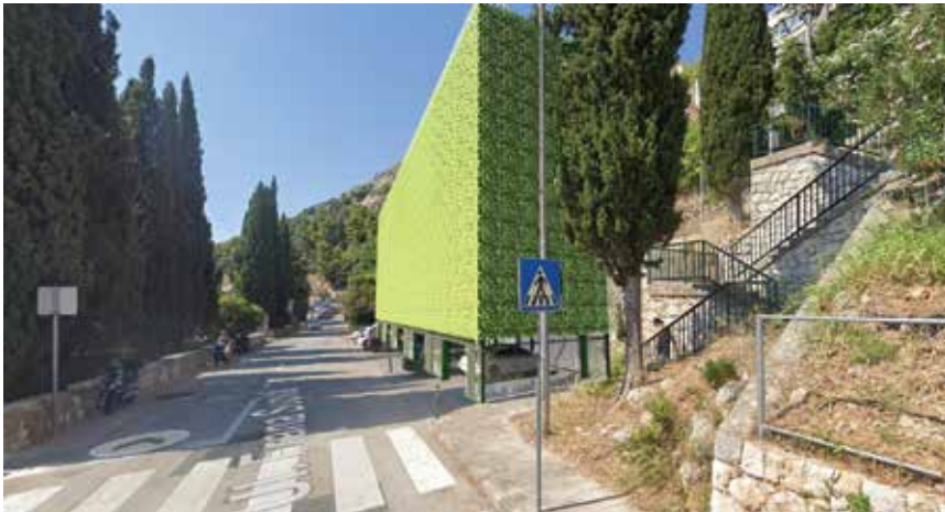
Projektno rješenje rotirajuće garaže u uskim ulicama

dubokih podzemnih garaža, čime se čuvaju prirodni resursi i smanjuje ugljični otisak.