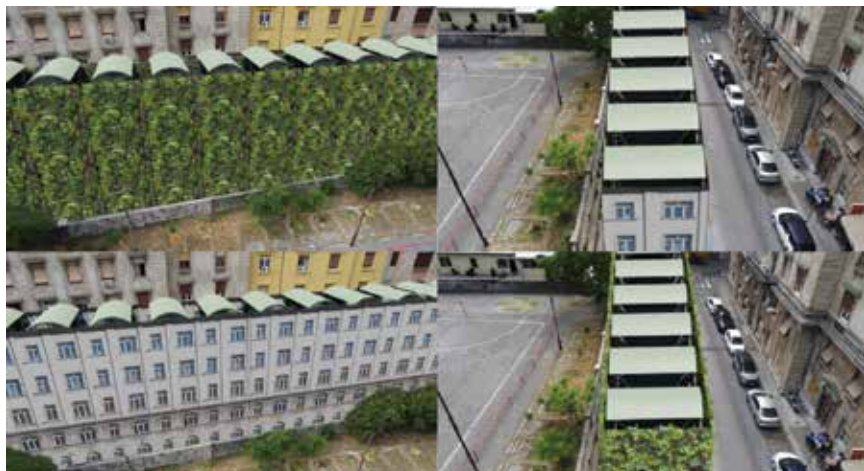
Vizualizacija rotirajuće garaže u stambenom naselju