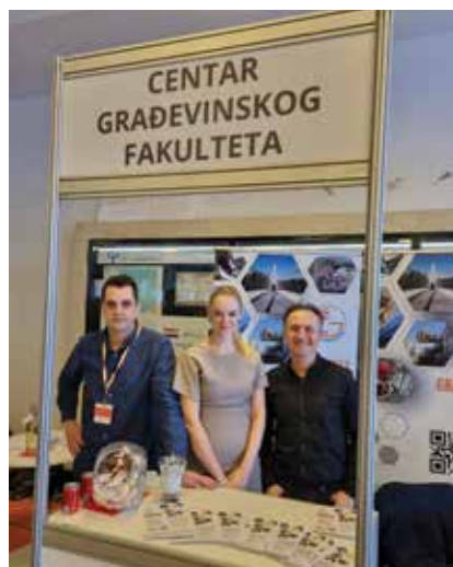
Izložbeni prostori izlagača na sajmu GRADify