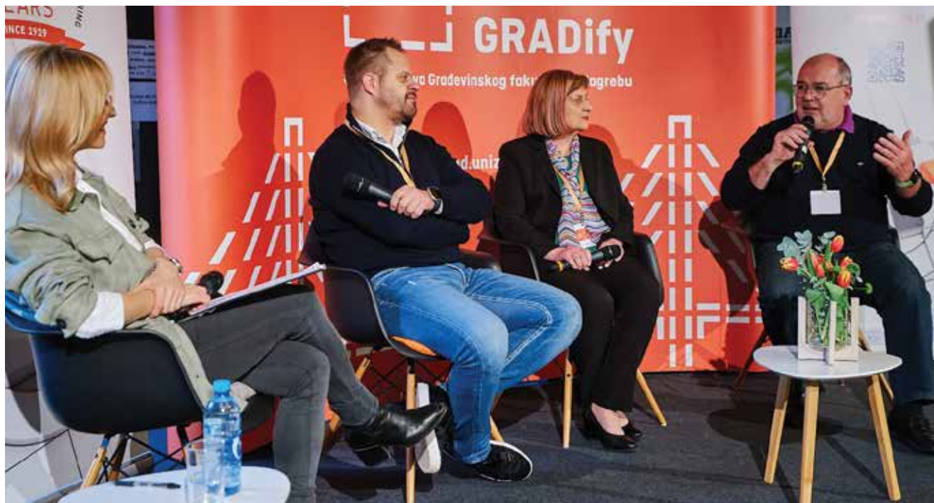
Predstavljanje građevinskih tvrtki razgovorom na panelima

ministarstvo sugeriralo povećanje upisne kvote. Jedna od glavnih poruka toga sajma bila je da posla ima za sve. Službeni dio programa počeo je u 13 sati javnim predstavljanjem rezultata projekta GRASP, koje je održala izv. prof. dr. sc. Saša Ahac, članica projektnoga tima GRASP.