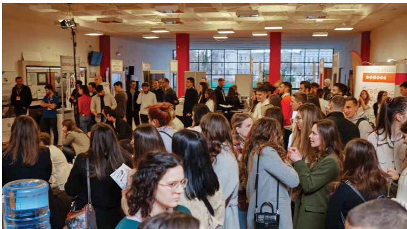
Studenti su ispunili cijeli ulazni prostor zagrebačkog Građevinskog fakulteta