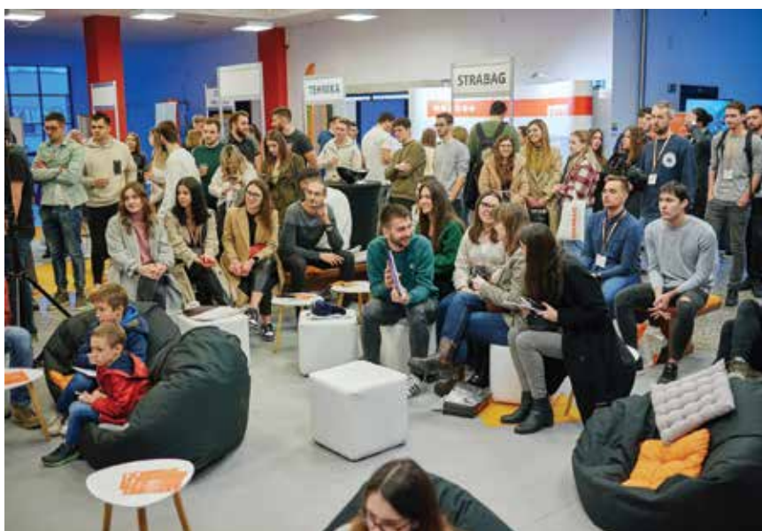
Otvaranje sajma poslova na Građevinskome fakultetu u Zagrebu