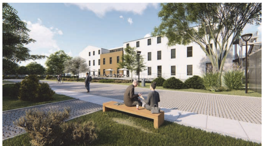
Rekonstrukcija vojarnje u Veteranski centar Petrinja – 3D simulacija zapadne strane

dijela s tri etaže i potkrovljem, koji je sa zatečenim objektom povezan prizemnim traktom. U veznome traktu organiziran je restoran s kuhinjom, s izlazom na prizemnu terasu i pogledom na buduću park vile Zinka koja je u rekonstrukciji. Krov prizemlja čini terasa, prošireni boravak katnih sadržaja. Nova dogradnja smještaja tretirana je kao jedinstven, neutralan i nenametljiv korpus povijesnoga okružja koju projekt prihvaća kao isključivu dominantu, ali uz karakternu valorizaciju primijenjenim materijalom i bojom. Kapacitet centra je 44 ležaja u dvokrevetnim sobama i dvije smještajne jedinice za stopostotne invalide sa zasebnim sobama za pratitelje.