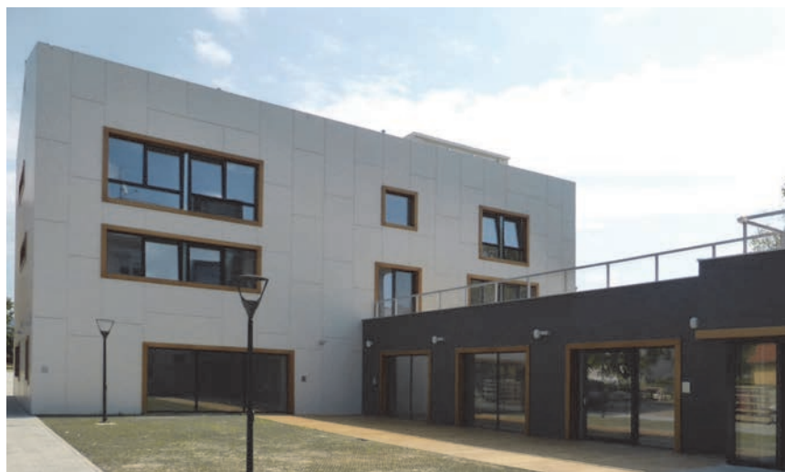
Dom hrvatskih veterana u Lipiku (DHV - Lipik), dvorišna pročelja dograđenoga dijela

U provedbi projekta sudjelovali smo u svojstvu autora, projektanta i projektantskoga nadzora. Zahtjevan dio provedbe bila je izrada programskih smjernica koje su izrađene multidisciplinarno, odnosno u izradi je sudjelovao širi krug stručnjaka unutar Ministarstva hrvatskih branitelja i izvan njega u svojstvu investitora i provoditelja programa. O kvaliteti programskih smjernica ovisila je provedba zacrtanih ciljeva u ograničenim prostornim uvjetima postojećega objekta, ali i mogućega proširenja, ograničenoga