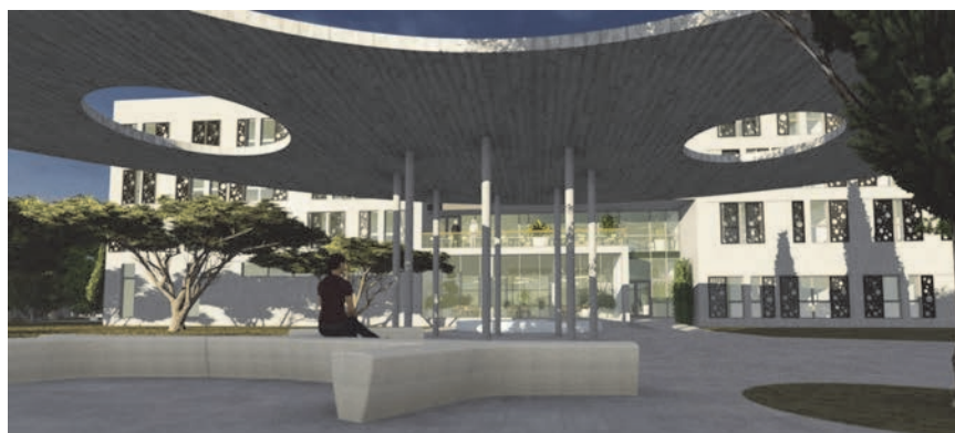
Rekonstrukcija vojarnje u Veteranski centar Šibenik – 3D simulacija južnoga područja ispod nadstrešnice

Veteranski centar Šibenik planiran je na prostoru bivše vojarnje Bribirski knezovi u Šibeniku, u zoni Mandalina, prema Solarisu. Površina zemljišta je oko 2,6 ha i na njoj su zatečene građevine bivše vojarnje bruto površine od 850 m 2 . Uz rekonstrukciju postojećega objekta predviđena