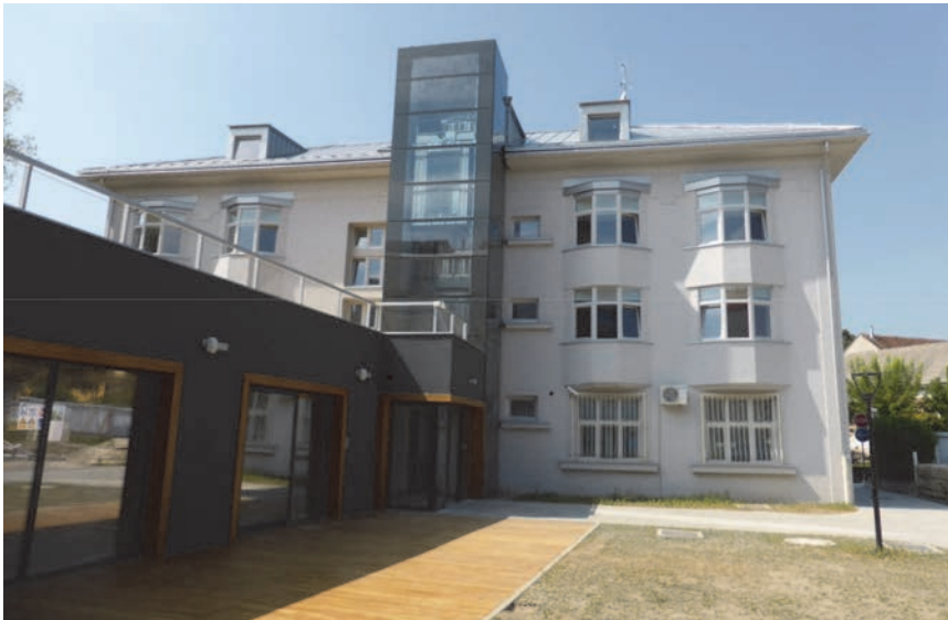
DHV Lipik – dvorišna pročelja

prostornim planovima, veličinom parcele i okolnim objektima (vila Zinka). Dio programa koji se odnosi na provedbu projektnih aktivnosti u izgrađenome objektu moguće je naknadno prilagoditi potrebama korisnika, ali prilagodbu prostora, ako nije kvalitetno koncipiran i odgovarajuće projektiran, nije jednostavno provesti.