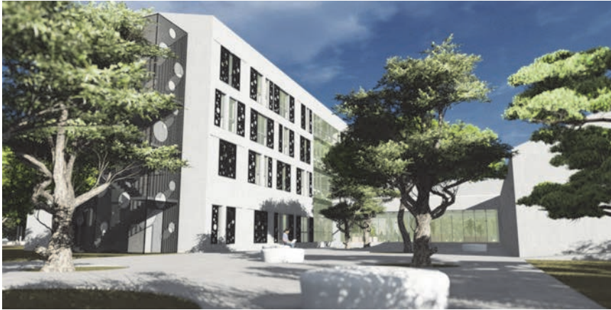
Rekonstrukcija vojarne u Veteranski centar Šibenik – 3D simulacija sjeveroistočnoga pročelja smještajnoga i “veznog” objekta

je nova izgradnja do ukupne bruto površine od oko 5150 m 2 .