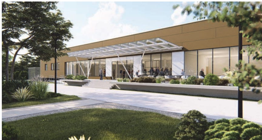
Rekonstrukcija vojarnje u Veteranski centar Petrinja – 3D simulacija južne strane glavnog ulaza

dionice i tečajeve te organizirati okupacijske aktivnosti, pružati psihosocijalna pomoć, provoditi fizikalna rehabilitacija, edukacijske i radne terapije, kineziterapije te organizirati sportske i rekreacijske aktivnosti u zatvorenim i otvorenim prostorima. Planirana je izgradnja bazena terapijske i rekreativne namjene.