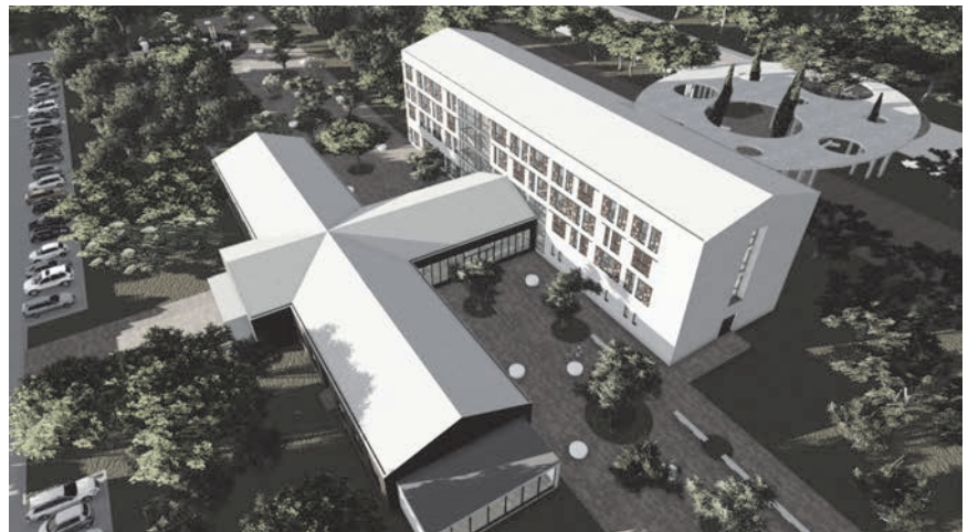
Rekonstrukcija vojarne u Veteranski centar Šibenik – 3D simulacija ptičje perspektive