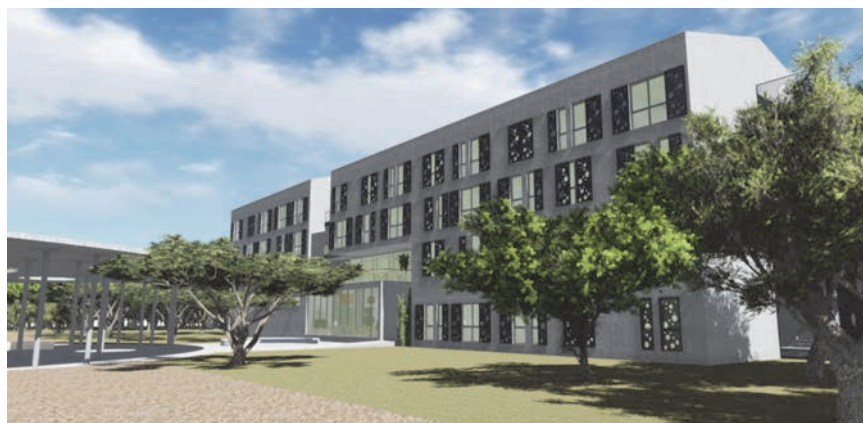
Rekonstrukcija vojarnje u Veteranski centar Šibenik – 3D simulacija jugozapadnoga pročelja smještajnoga objekta