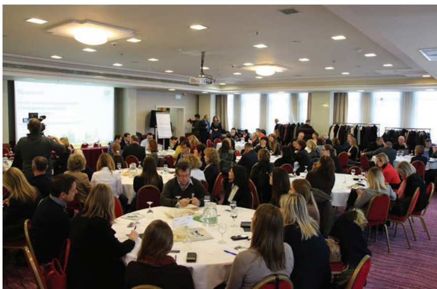
Detalj snimljen tijekom održavanja Drugog otvorenog dijaloga partnera

Novi potpisnici koji su pristupili potpisivanju Povelje na Drugom otvorenom dijalogu partnera i pridružiti se partnerstvu jesu Inoutic d.o.o. , Colliers Advisory d.o.o. , Agencija za pravni promet i posredovanje nekretninama, Građevinski fakultet Sveučilišta u Zagrebu, REA Sjever, Međimurska energetska agencija, Regionalna energetska agencija Sjeverozapadne Hrvatske, HEP ESCO d.o.o. , DANFOSS d.o.o. , Građevinski i arhitektonski fakultet