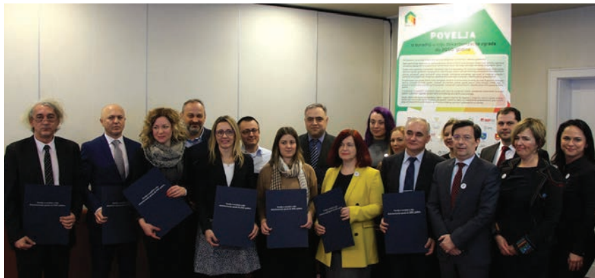
Novi partneri koji su pristupili potpisivanju Povelje na Drugom otvorenom dijalogu partnera