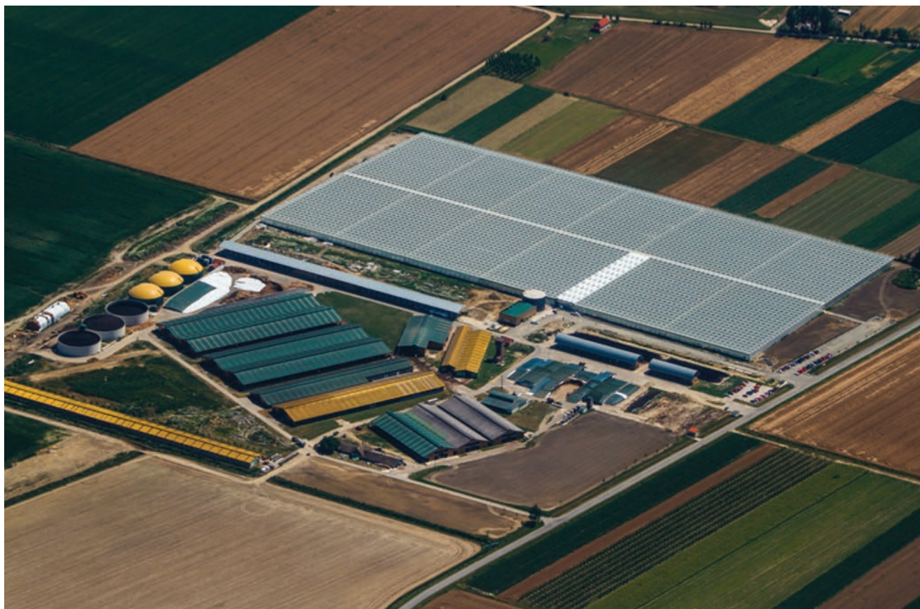
Slika 4. Bioplinsko postrojenje, istočna Hrvatska

znih tipova. Prvi dokument koji se bavi kvalitetom krajobraza u sklopu prostornog uređenja bila je studija Krajolik – Sadržajna i metodska podloga Krajobrazne osnove Hrvatske iz 1999. godine. Sljedeći dokument izdan je šesnaest godina poslije pod naslovom Krajolik kao kulturno nasljeđe (Dumbović Bilušić, 2015.). Ti dokumenti nemaju zakonodavnu snagu, no preporučuju se kao metodološka osnova prilikom analize i vrednovanja krajolika u Hrvatskoj. Iako je Hrvatska usvojila Konvenciju o europskim krajobrazima ( European Treaty Series 176 ) još 2000. godine, sa stupanjem na snagu 2004. detaljna klasifikacija krajolika i izrada atlasa krajobraza do danas nisu provedeni. Aktualni dokument Strategija prostornog razvoja Republike Hrvatske usvojena 2017. godine (NN 106/17) kao cilj postavio je očuvanje identiteta prostora. Strateške aktivnosti obuhvaćaju i izradu Krajobraznog atlasa RH koji sadržajno treba obuhvatiti tipologiju krajobraza državnog teritorija na regionalnoj razini, definira-