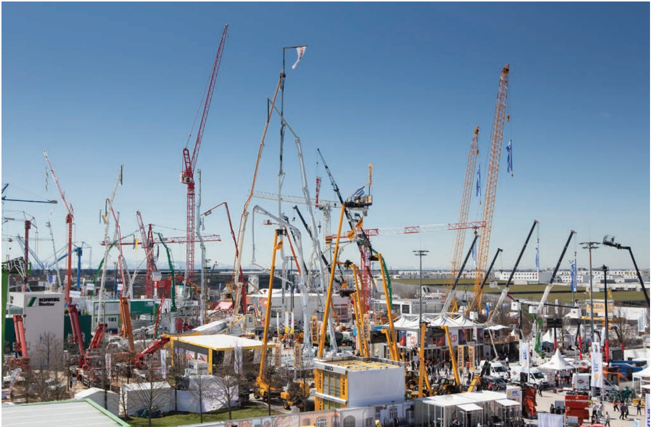
Tipična vizura za vrijeme trajanja sajma Bauma

na tome sajmu predstaviti novosti te se u skladu s time očekuje čitav niz međunarodnih premijera povezanih s mehanizacijom za građevinarstvo, građevinskim materijalom i rudarstvom, kao i građevinskim vozilima i opremom. Na sajmu se sklapaju i konkretni poslovi.