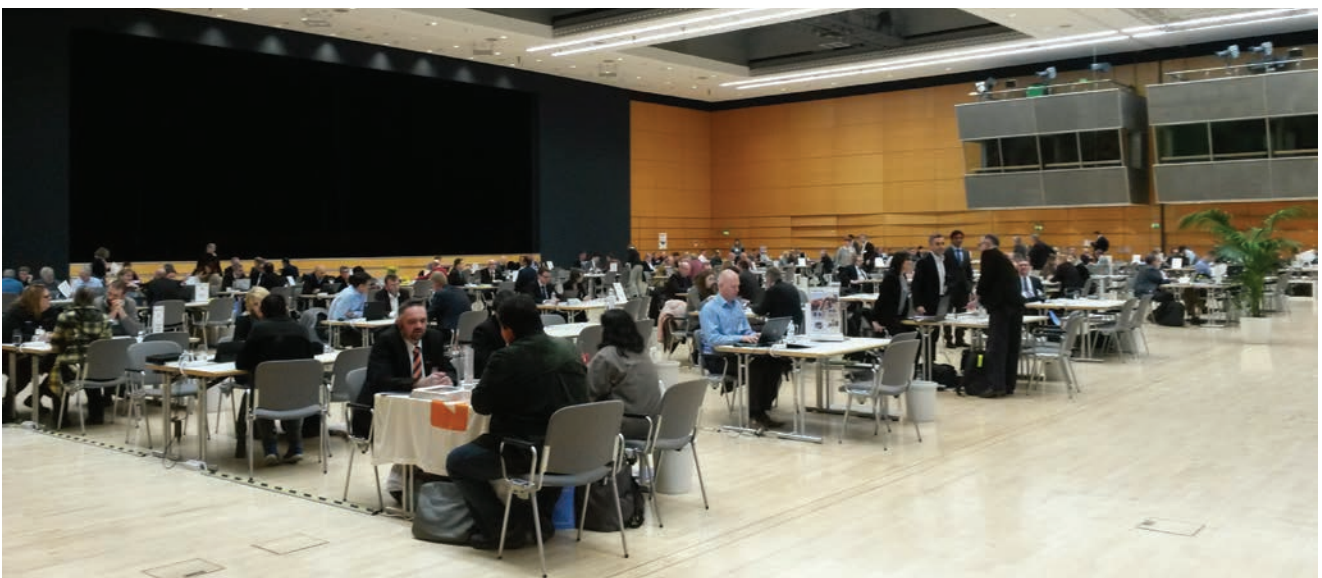
Pogled na dvoranu u kojoj su održani razgovori izlagača i novinara

Sajam u Münchenu izgradio je i globalnu mrežu organizacije međunarodnih sajмова za građevinsku mehanizaciju. Uspješan koncept koji stoji iza Baume prenesen je i u niz zemalja izvan Njemačke - Kinu, Indiju i Južnoafričku Republiku - uzimajući u obzir potrebe tih regionalnih tržišta.