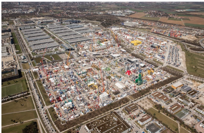
Bauma ispunjava čitav izložbeni prostor minhenskog sajma

Bauma je žila kucavica industrije. Omogućuje susrete s predvodnicima na međunarodnome tržištu i upoznavanje s najnovijim inovacijama iz cijelog svijeta.