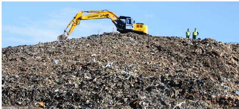
Sadašnje stanje odlagališta Bikarac

U trećoj fazi, priprema koje je u tijeku, radit će se na izgradnji postrojenja za mehaničko-biološku obradu (MBO).