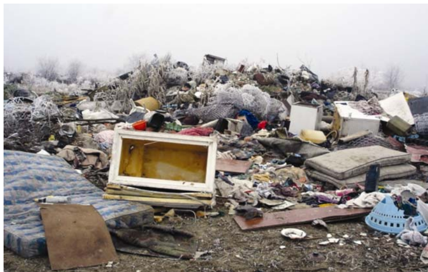
Detalj s odlagališta

metara jugozapadno od naselja i od prvih je kuća udaljeno stotinjak metara. Na sjeveroistočnom je rubu odlagališta tvornica kože Psunj , a s istočne strane, udaljen tristotinjak metara, protječe potok Rešetarica. Sa zapadne se strane u neposrednoj blizini nalazi izgrađeno i neizgrađeno građevinsko područje. Odlagalištu se prilazi makadamskim putem koji je u kišnom razdoblju teško prohodan. S tim je putem, dugim 400 m, odlagalište povezano s prometnicom koja spaja Požešku kotlinu i taj dio Slavonije s autocestom Zagreb – Livovac.