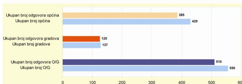
Slika 2. Prikaz odaziva na upitnik

posebnom zakonu ovlaštenu provoditi prostorne planove izdavanjem akata kojima se odobravaju zahvati u prostoru i građenje. Međutim, u vezi s nelegalnom gradnjom, osim ispunjavanja obveza prostornog ure-