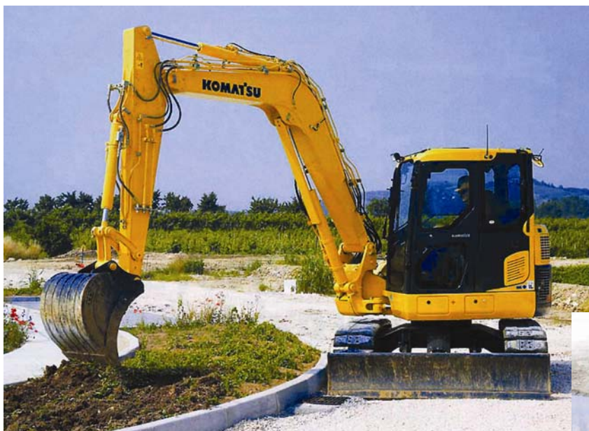
Midibager u radu

Kompaktni bager srednjega razreda ugodan je za vozača, ima vrhunske radne karakteristike te uzak polumjer vrtnje zadnjeg dijela stroja koji prelazi gusjenice za samo 175 mm. Vozač se može usredotočiti na rad bez brige da bi vrtnjom stroja dotaknuo okolne građevine.