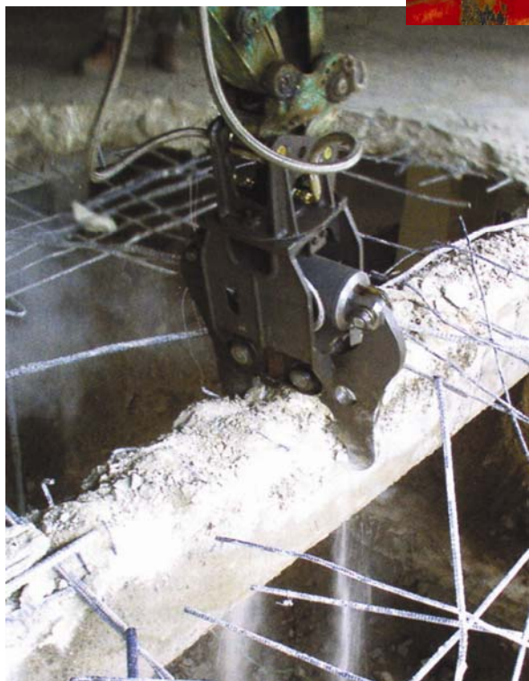
Minidrobnica betona u radu

Hidraulične se drobilice primjenjuju u obnovi starijih zgrada gdje je dostupnost većim strojevima onemogućena ili zbog nosivosti tla nisu pogodni za vožnju po betonskim pločama, posebno u gusto naseljenim područjima gdje je potrebno stare zidove razgrađivati iznutra.