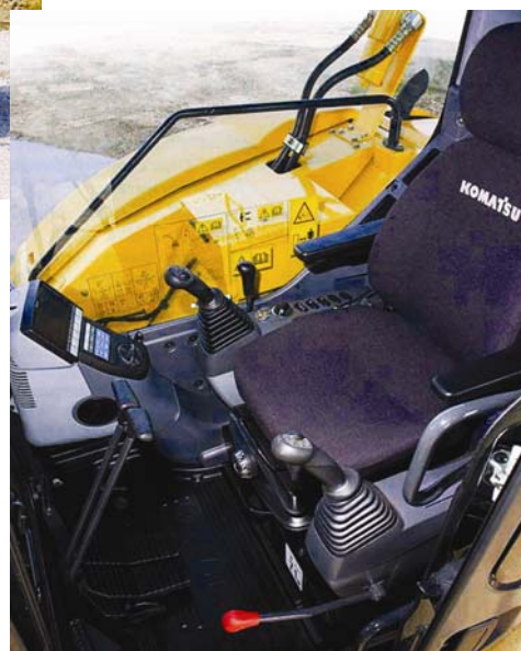
Unutrašnjost kabine bagera

Jednostavan je pristup svim servisnim točkama te je olakšano servisiranje i održavanje. To istodobno skraćuje i skupo neiskorišteno vrijeme kada je stroj izvan pogona. Hladnjak motora, hladnjak punjenja zraka i ulja izrađeni su od aluminija koji poboljšava njihovu učinkovitost, a montirani su paralelno za brže i lakše čišćenje. Filtri za gorivo i ulje te svi ispusni ventili za gorivo jednostavno su dostupni. Kontrolni sustav prati sve ključne sustave i karakteristike motora, na primjer