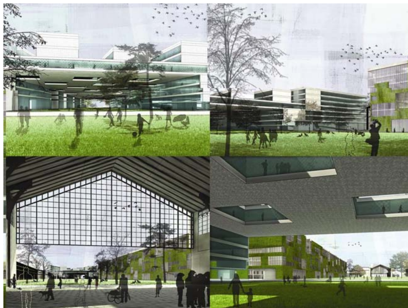
Prvonaagrađeni rad - smještaj ministarstava u Budimpešti

onih koji su izravno pod utjecajem loše planiranih aktivnosti i politika. Propituje se i sam demokratski sustav jer se čini da omogućuje negativnu selekciju i samovolju nekompetentnih pojedinaca u odlučivanju o milijunskim projektima. To su česta mišljenja građanskih aktivističkih skupina. Druga izrazito nezadovoljna skupina svakako su poduzetnici koji su ključni za provedbu javno financiranih projekata. Krajnji su korisnici određenih javnih politika i razvojnih projekata građani, ponekad ciljane skupine, a ponekad šire društvo kada se radi o projektima od općeg interesa (npr. infrastruktura).