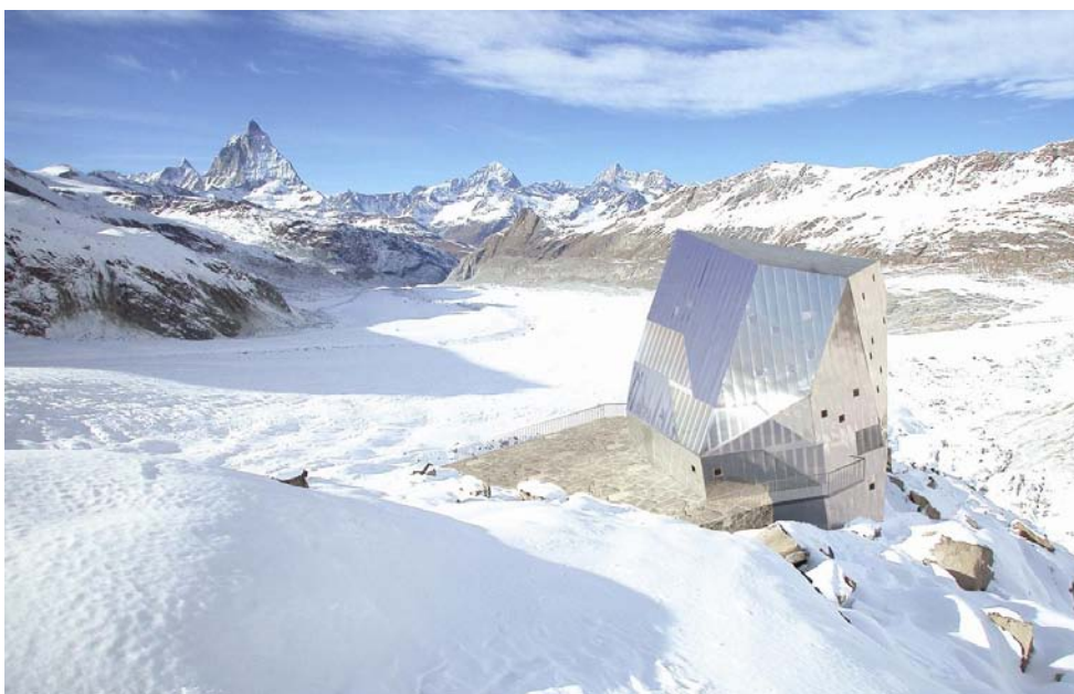
Koliba Monte Rosa