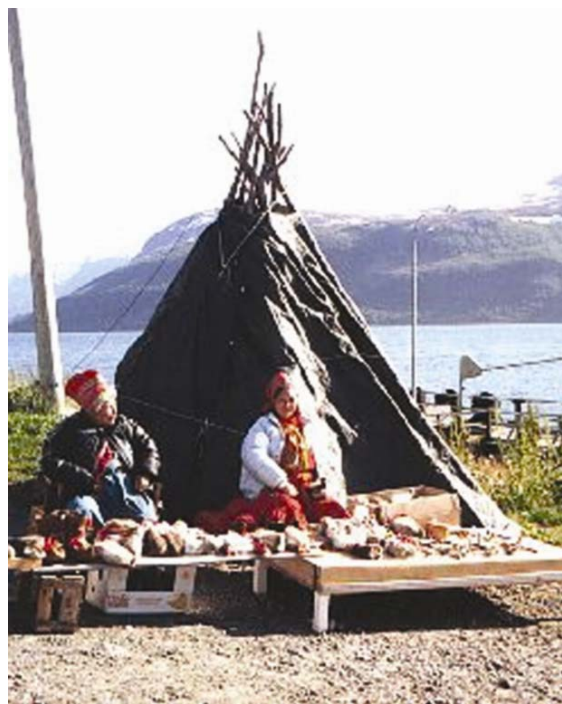
Pripadnice samskoga naroda ispred tradicionalnoga šatora lávvo

Sámi sami sebe smatraju "Indijancima sjevera", a njihov je narod jedan od najstarijih naroda Europe. Kultura im se razvijala pod utjecajem činjenice da su se prvobitno bavili lovom i ribolovom, a kasnije, u 16. stoljeću, postaju nomadi i uzgajaju vlastita stada sobova. Ovaj narod ima dugu povijest i bogatu kulturnu baštinu.