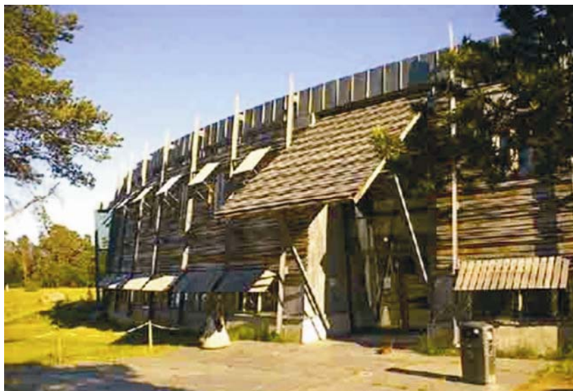
Drveno pročelje polukružne građevine

Na vanjskome omotaču drveni elementi ističu vertikalnost i simbolič-