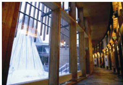
Hodnik do pojedinih dvorana s pogledom na stožastu cjelinu građevine

Osnovni su oblikovni elementi građevine, ukupne površine 5300 m 2 , polukružna građevina i stožac. Polukružna građevina s unutrašnje strane luka štiti dvije cjeline. Jedna se nalazi odmah uz luk, horizontalna je i završava pročeljem unutrašnjega dvorišta. Druga, manja i vertikalna cjelina dominira cijelim kompleksom. Odvojena je od ostatka građevine i ima jedinstven simbolični oblik tradicionalnoga nomadskoga šatora samskog naroda "lávvo" koji se bitno ne razlikuje od šatora sjevernoameričkih Indijanaca. U tom je visokom stošcu glavna dvorana skupštine, a izdiže se u južnom dijelu građevine. U stožac na četvrtini tlocrta prodire zastakljeni šiljak koji dvoranu parlamenta spaja s administrativnom zgradom. Ovaj «hodnik» vodi do galerije iznad dvorane za sjednice koja je osvijetljena dnevnim svjetlom staklenim dijelom stošca.