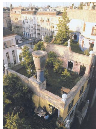
Primjer intenzivnoga zelenog krova

Ekstenzivni zeleni krov uobičajeno znači nisko rastuće bilje koje ne zahtijeva puno njege i održavanja i jeftino je. Hod je po takvoj krovnoj površini ograničen na nužno potrebno održavanje. Ekstenzivno zelenilo zahtijeva posebno pripremljen supstrat. Zbog razmjerno niskog sloja (6 do 18 cm, iznimno i manje), izbor biljaka je ograničen na nezahtjevno zelenilo. Zalijevanje i dohranjivanje potrebno je samo u fazi rasta, dok vegetacija ne prekrije 60 posto površine i