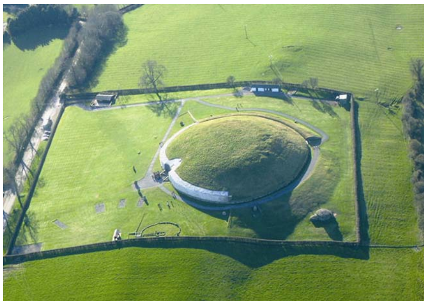
Ekstenzivni zeleni krov odmah nakon sađenja

Ekstenzivni zeleni krov uobičajeno znači nisko rastuće bilje koje ne zahtijeva puno njege i održavanja i jeftino je. Hod je po takvoj krovnoj površini ograničen na nužno potrebno održavanje. Ekstenzivno zelenilo zahtijeva posebno pripremljen supstrat. Zbog razmjerno niskog sloja (6 do 18 cm, iznimno i manje), izbor biljaka je ograničen na nezahtjevno zelenilo. Zalijevanje i dohranjivanje potrebno je samo u fazi rasta, dok vegetacija ne prekrije 60 posto površine i