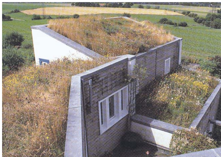
Biotopski zeleni krov

Biotopski zeleni krov temelji se na prirodnome nosivom sloju, na kojem raste isključivo samonikla autohtona vegetacija koja ne zahtijeva njegu i održavanje te bez teškoća podnosi sušna razdoblja.