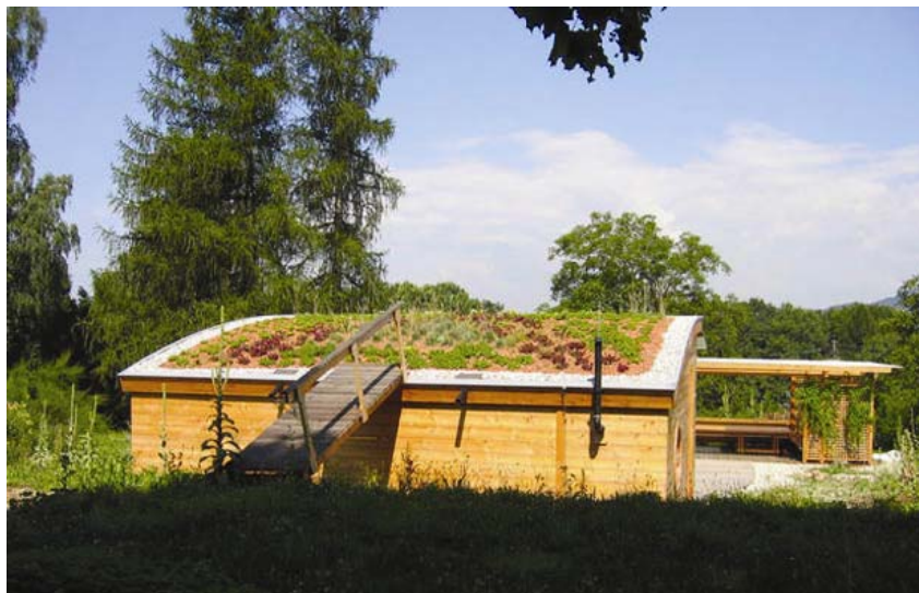
Travnati buseni iznad groblja Newgrange više od 5000 godina služe kao pokrov

U načelu se ozelenjuju krovovi do nagiba 35 posto, u određenim sluča-