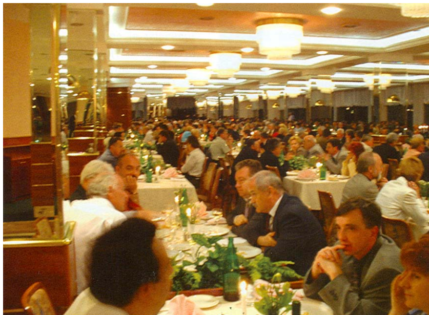
Zajednička večera sudionika Sabora 2004