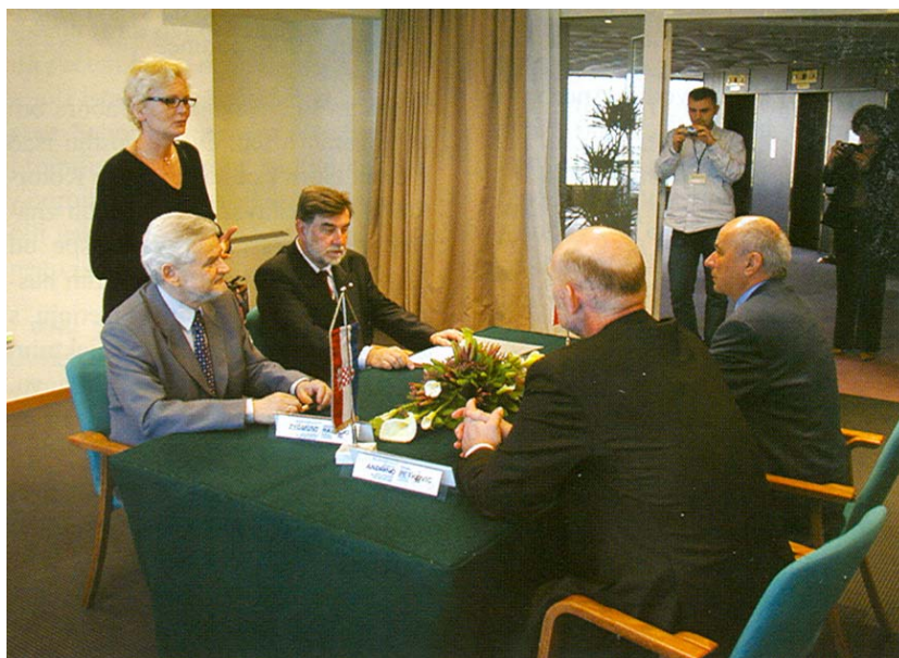
Potpisivanje sporazuma između PZITB-a i HSGI-a

Valja istaknuti da je u pauzi između prijepodnevnog i poslijepodnevnog