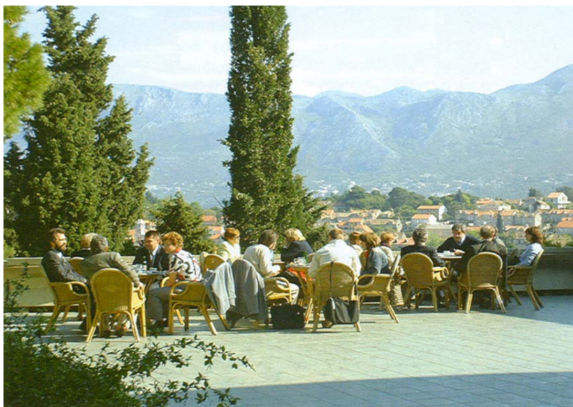
Ugodno je bilo odmoriti se u stankama na terasi hotela