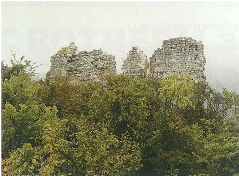
Dio ruševina okružen raslinjem

nica znade mnogo više, iako sve treba uzimati s rezervom jer se temelji na usmenoj predaji. Ne samo da su se ovdje borili Ljudevit Posavski i Borna, ban Bijele Hrvatske, već je tu boravio i sv. Metod kad je drugi put iz Moravske putovao na opravdanje u Rim. Čak je, navodno, iz Modruša rodom i Gorazd, učenik sv. Metoda. Prema predaji, u Modrušu