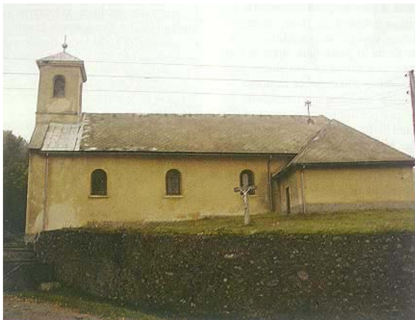
Današnja župna crkva Sv. Trojstva

u nedavnom Domovinskom ratu, utemeljeno je u Zagrebu Zavičajno društvo Bernardin Frankopan . Ono je najprije obnovilo u cijelom kraju poznato modruško proštenje. Prva je skromna svečanost održana 1994. još pomalo u strahu pred topovskim cijevima s obližnjih brda Vojnovca i Plaškog, ali su sljedeće bile prepune