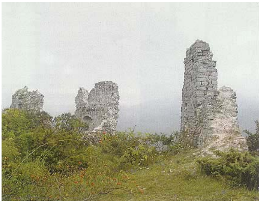
Ostaci jedne kule

je krajem 10. st. propovijedao i sv. Vojtjeh. Čak je, tvrdi se, na obližnjem Gvozdu na Kapeli poginuo i posljednji hrvatski kralj Petar Svačić u 11. stoljeću. Valja ipak reći da tvrđnja ne stoji. Planinski masiv Velike i Male Kapele zaista se nekad nazivao Gvozd, a sadašnje je ime dobio prema jednoj (vjerojatno pavlinskoj) kapelici u blizini gorskog prijevoja.