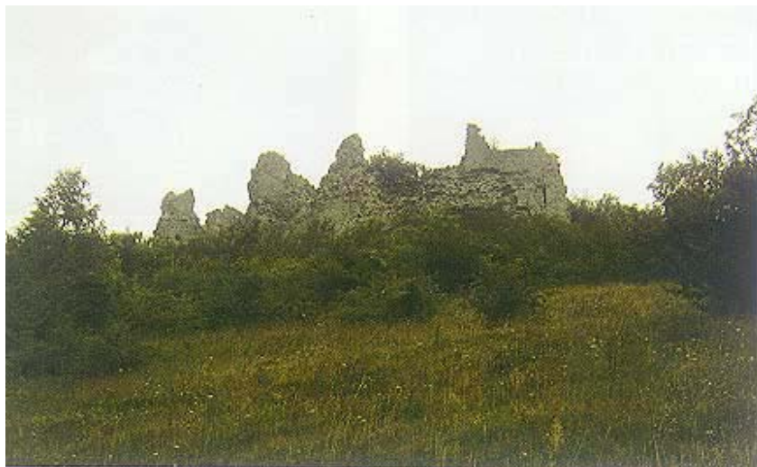
Ruševine utvrde na vrhu brijega

Vjekoslav Klaić smatra da je naselje na tom području postojalo "jamačno već oko 820. kad su onuda bjesnile teške borbe između knezova Borne i Ljudevita". Modruška župska spome-