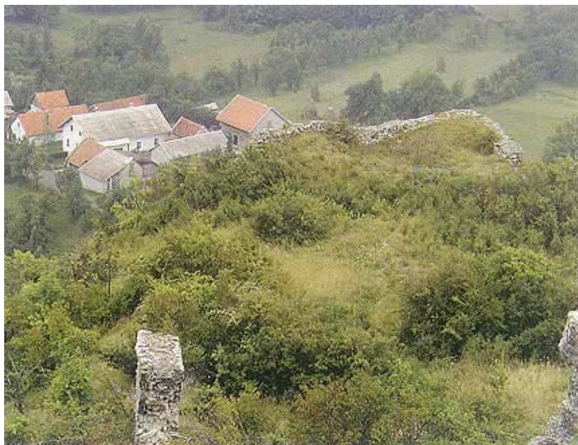
Pogled iz utvrde na dio današnjeg Modruša

jem i jačanjem feudalne vlasti gospodara kastruma i zamka, ali i razvitkom naselja koje postaje značajno po broju stanovnika te po ulozi koju je imalo u gospodarskom, trgovačkom, kulturnom i crkvenom životu, feudalni se grad i imenom izdvaja iz tog nekadašnjeg povijesnog jedinstva. Modruš je tada trgovište ili grad sa svojim prihodima, gradskom upravom, crkvom i građanima, dakako pod patronatom knezova Frankopana. To je vrlo jasno istaknuto i u diobenoj ispravi gdje se izričito navodi da Stjepan dobiva: "Modruš trgovište s kastrumom Tržan". Značenje imena Tržan nije teško dokučiti jer