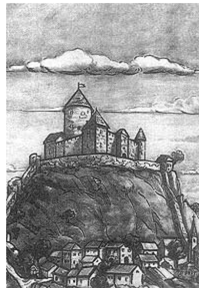
Modruška utvrda na vitraju crkve Sv. Trojstva (uništenom u Domovinskom ratu)

Modrušana i njihovih gostiju iz svih krajeva. Također je i od strane Modrušana iz samog Modruša utemeljeno Kulturno-umjetničko društvo Gradina . Tako naime u Modrušu nazivaju ruševine starog Tržan-grad. Godine 1996. društvo Bernardin Frankopan u suradnji s zajednicom zavičajnih društava Like Vila Velebita , otkrilo je spomen-ploču na crkvi Sv. Trojstva u spomen 510. obljetnice Modruškog urbara. Zavičajno je društvo uz pomoć samih Modrušana i uz razumijevanje općine Josipdol uredilo učionice osnovne škole, u kuće su uvedeni telefoni, a nastoji se dovesti i pitku vodu. Ujedno je društvo pokrenulo i cijeli niz izdanja koja govore o slavnoj modruškoj povi-