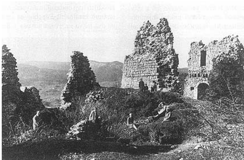
Jedna od najstarijih fotografija ruševina modruške utvrde s početka 20. st.

remljena sa dva veća topa, pet mužara, 31 većom i deset manjih pušaka te 10 centi praha. Frankopani su uzalud u više navrata tražili grad natrag, jednostavno Modruš je bio uključen u sastav Vojne granice.