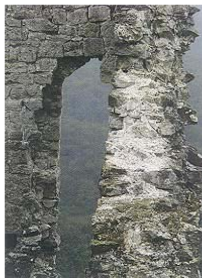
Ostaci jednog prozora s vidljivim tragovima ispunje zidova

gospodario najvažnijom prometnicom prema moru i učinio je cestom