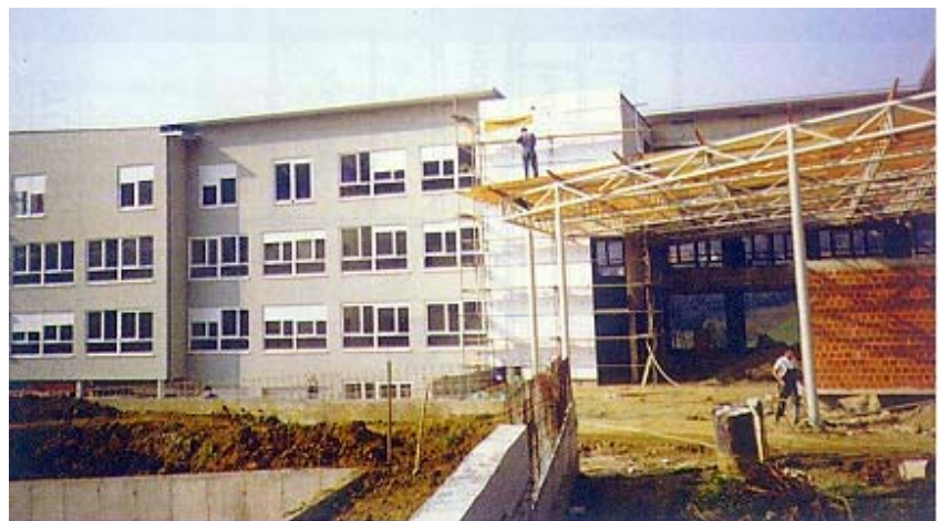
Pogled na zgradu nove škole u izgradnji

a izborni su njemački, španjolski i kineski), sve školske knjige, uniformu, umjetničke radionice, informatičke radionice, dramsku nastavu od prvog razreda i učenje borilačkih vještina (nanbudo). Štoviše oni koji uče kineski u ovoj školskoj godini boravit će na proljeće mjesec dana u Kini, zemlji koja uz Englesku ima najbolje privatne škole na svijetu. Čak je predviđen i poseban 15-dnevni posjet roditelja Kini. Škola će nakon useljenja u vlastitu zgradu uspostaviti suradnju sa sličnim engleskim, njemačkim i kineskim školama.