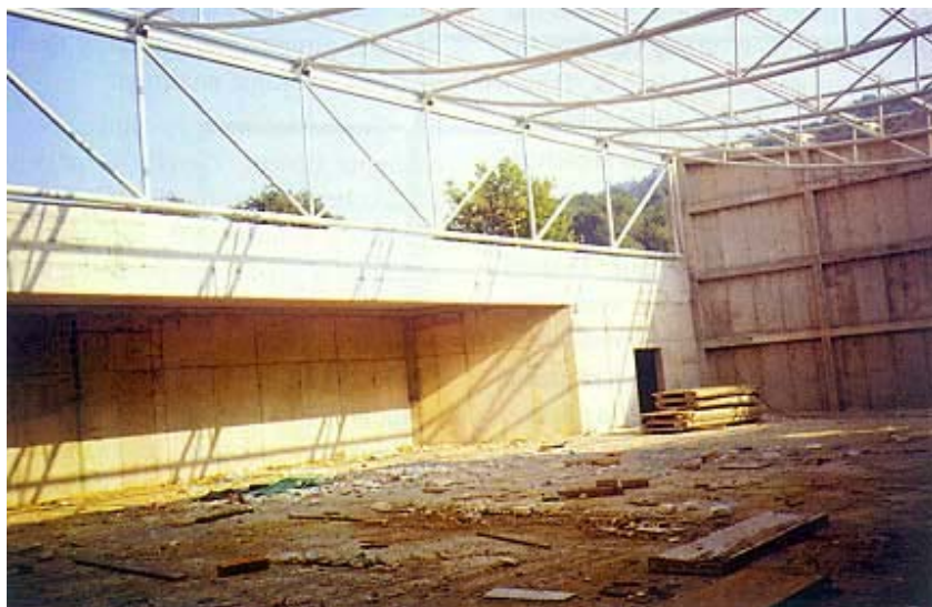
Detalj iz velike športske dvorane u izgradnji

njem prostora u državnim školama ima mnogo problema, često uzrokovanih sebičnošću i samovoljom zaposlenih. Iako to dr. Časl nije spominjao, upravo se prije dvije godine po novinama dugo razvlačila afera o najmu prostora za njegovu školu na slobodnom katu III. ekonomske gimnazije u Zagrebu. Nešto novca koji je zaradio svojim patentima uložio je u otkup zemljišta u Dedićima u Šestinama. Uspio je otkupiti približno 18.000 četvornih metara, unatoč nesređenim imovinsko-pravnim odnosima.