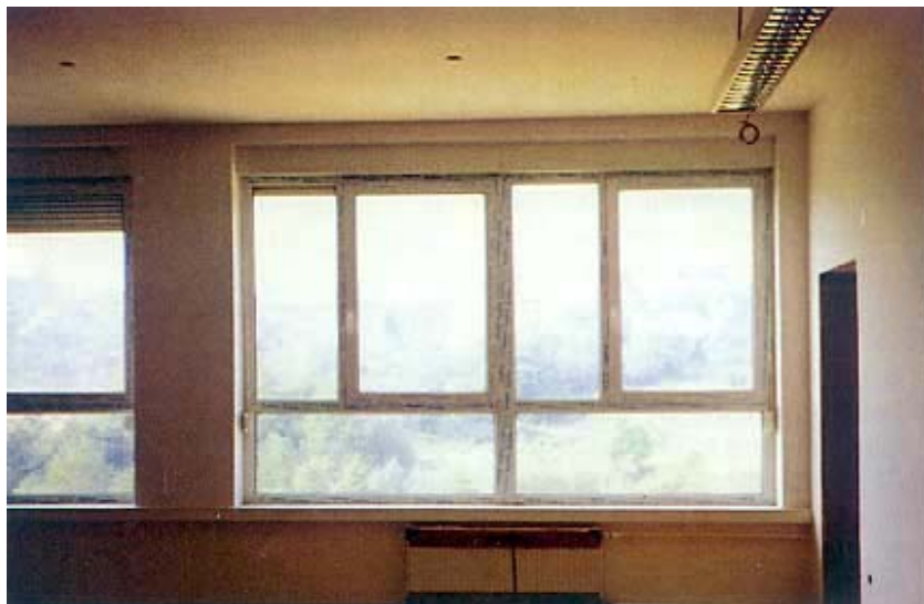
Pogled kroz prozor jedne učionice