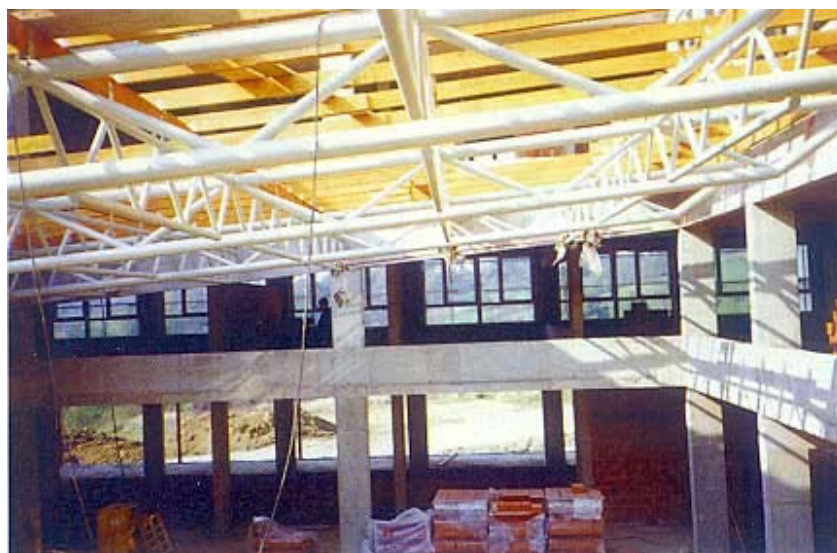
Radovi na budućem školskom predvorju