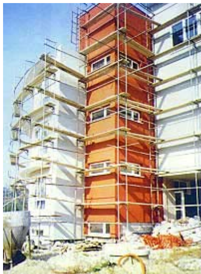
Uređivanje dijela pročelja

Uz veliko glavno ulazno predvorje smješteno je i glavno školsko stubište, a postoje još dva stubišta unutar zgrade i jedno vanjsko protupožarno