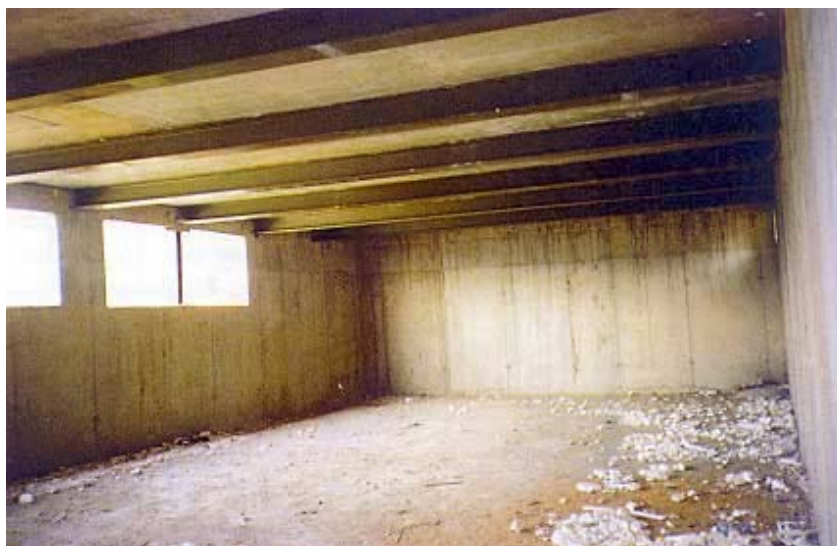
Unutrašnjost manje športske dvorane

se učenici u novu školu usele početkom ove školske godine. No s gradnjom dijelova škole želje su se i namjere investitora sve više povećavale i na kraju je odlučeno da se izgrade svi dijelovi konstrukcije i grubi građevinski radovi, a da se nakon useljenja učenika postupno opremaju ostali sadržaji koji nisu nužni za početak nastave. Odlučujuća je za završetak izgradnje ipak bila činjenica što je dobiven povoljan zajam od Erste und Steirmärkische Bank (ESB).