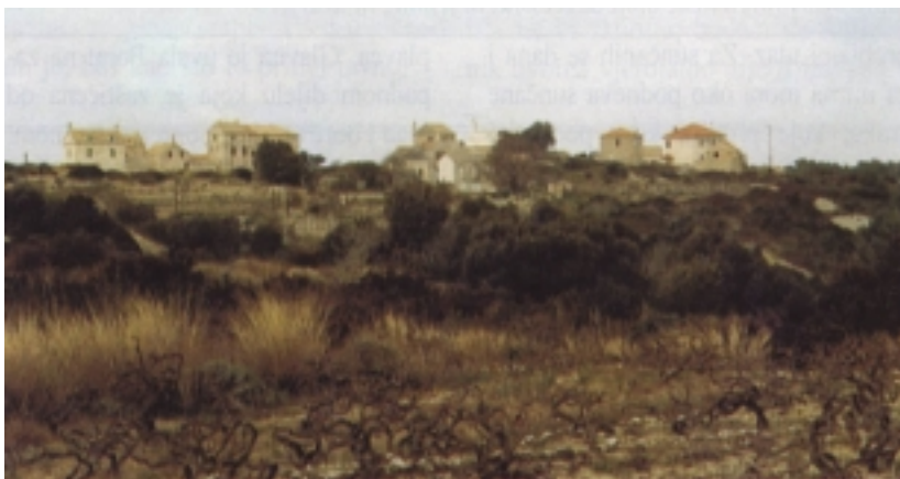
Uvala Porat na Biševu