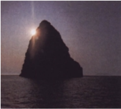
Obrisi otoka Jabuke

s talijanske obale prema rtu Ploči. More oko ovog otočića obiluje ribom (plave ribe i zubatac) i rakovima (jastog i škampi), na otoku je gnjezdište galebova, a uspijevaju i endemične vrste biljaka.