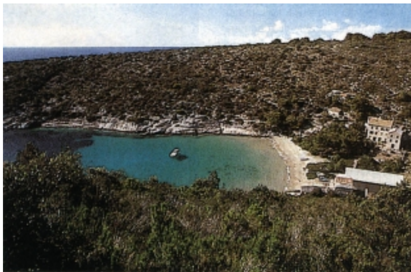
Uvala na Brusniku

Jugoistočno od Sv. Andrije, od kojega je udaljen 1,7 milja (3 km), smješten je nenastanjeni otočić Brusnik , dug 300 m, a prosječno širok 150 m. Građen je pretežno od eruptivnog kamena (dijabaza), zbog čije se crne boje vidi iz velike daljine, iako je