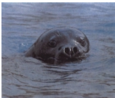
Rijetka slika sredozemne medvjedice

Najveći među njima je Visu najbliži otok Biševo na jugozapadu, udaljen približno 5 nautičkih milja (9 km) od