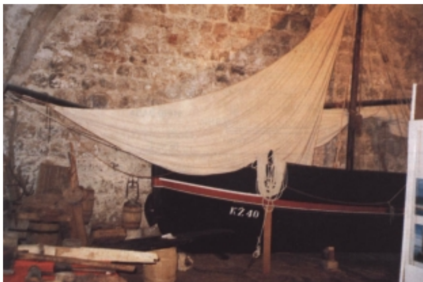
Falkuša u Ribarskom muzeju u Komiži

jača i kako broj ribara raste, riba počinje loviti na predjelu Trišjavca u blizini Biševa te oko Svetog Andrije, Brusnika i Jabuke te Palagruže.