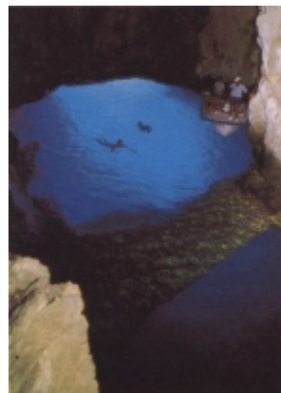
Unutrašnjost Modre špilje na Biševu

plavca. Glavna je uvala Porat na zapadnom dijelu koja je zaštićena od juga i bure te Mezuporat na istočnom, uvala kojega je zaštićena od juga. Središnji otočki zaselak je Poje u kojem se nalazi i spomenuta crkva i gdje je 1938. godine bila izgrađena i škola. Do tog su mjesta u sredini otoka nje-mački zarobljenici u Drugome svjetskom ratu izgradili jedinu otočku makadamsku cestu od uvale Mezuporat. Lovišta male plave ribe oko otoka Biševa bila su najbolja na čitavom viškom ribolovnom području. Na prvome je mjestu to je bila uvala i pličina