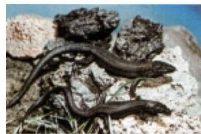
Endemska crna gušterica na Brusniku

Iako su vjetrovi jaki ima dosta humusa na kojem raste oskudna vegetacija. Nalazi ostataka nekih i sad postojećih školjkaša u kamenu upućuju da se Brusnik uzdigao iz mora tek u zadnjem geološkom razdoblju. Oko Brusnika i okolnih hridi najbogatija su lovišta najkvalitetnije ribe i rakova. Često ga posjećuju ribari sa Svetog Andrije, Biševa i Komiže za lova na sardele. Inače Brusnik je dobio ime