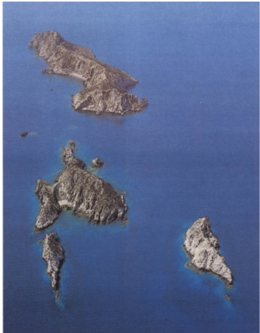
Zračni snimak dijelaotočne skupine Palagruža

moru u cijelosti. Naime u Nacionalnom programu razvitka otoka , usvojenom u Saboru 28. veljače 1997. godine, piše da Palagruža (najveći otok u palagruškoj skupini) ima 20 četvornih kilometara. Taj se podatak, koliko smo uspjeli utvrditi, prvi put spominje u Pomorskoj enciklopediji iz 1978. godine, a uredno ga prepisuju svi u međuvremenu izdani priručnici i leksikoni Leksikografskog zavoda Miroslav Krleža , koji je pripremio i podatke za Nacionalni program. No u tom materijalu ide se i korak dalje i Palagruža se svrstava na 21. mjesto po veličini među svim hrvatskim otocima. Da je to točno Palagruža bi bila približno četiri puta veća od obližnjih