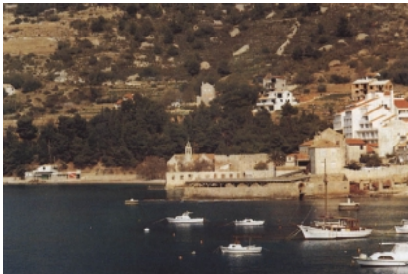
Jastožera - zgrada za čuvanje živih jastoga u Komiži

Komižani su ustrojili i pokrenuli ribarstvo i ribarsku industriju Sjedinjenih Država na pacifičkoj obali i to im zaista svi priznaju. Tvrdi se da su u SAD udicu donijeli Norvežani, a mrežu Hrvati-Komižani. I danas oni praktički vladaju ribarskom industrijom