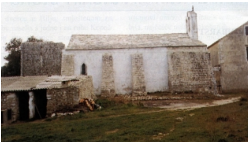
Crkva Sv. Silvestra