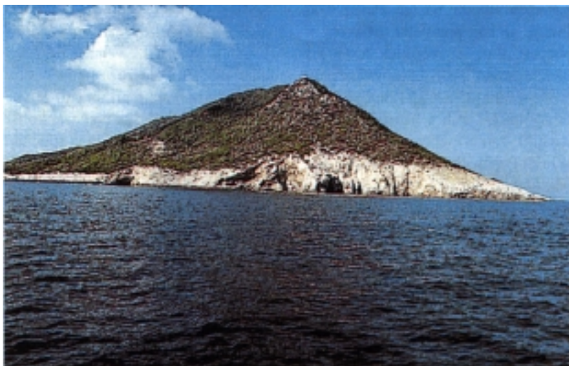
Otok Sv. Andrija

od Visa i 11,2 Nm (19 km) sjeverozapadno od Biševa. Pruža se u smjeru jugozapad-sjeveroistok, dug je 3,6 km, širok do 1,4 km, a površina mu je 4,6 km 2 . Građen je od gornjokrednih vapnenaca, ali ima nešto malo dijabaza i melafira. Ima nekoliko vrhova viših od 200 metara, a najviši je vrh Kraljičino 311 m. Obale su vrlo strme i neposredno graniče s dubokim morom. Otok je pokriven gustom makiom, a jedino je naselje, koje je 1953. imalo 64 stanovnika, smješteno blizu uvale Slatina u kojoj je bilo improvizirano izvlačište brodova. Odnedavno je, nakon sanacije komiškog lukobrana, jedna velika Pomgradova dizalica, uz pomoć Komižana podrijetlom s ovog otoka, uredila malu rivu i zaštićenu uvalu s izvlačištem brodova Povla buk, što je jedina koliko-toliko sigurna uvala na Svetom Andriji. Na otoku su pronađene ruševine romaničkog samostana i crkve Sv. Andrije, koji su također pripadali benediktincima.