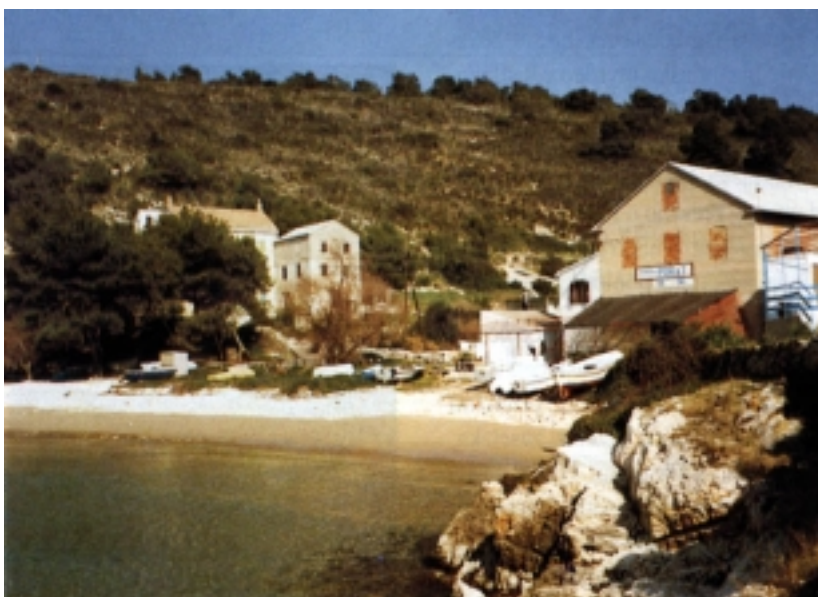
Poje - središnji zaselak Biševa

Trišjavac (Trešljavac) na južnom dijelu otoka, ali dobra su lovišta bile i njegove preostale uvale. Na biševskim su lovištima zabilježeni najveći pojedinačni ulovi. Tako je u jednoj noći u 18. stoljeću ulovljena 31 t, 1909. s potegačama i vojkama 40 t, a 1936. godine 45 t sardela, što nije zabilježeno nigdje na Jadranu do pojave velikih mreža plivarica. Zabilježeno je kako se jedna trećina lovine s Trišjavca morala od 1621. davati za zidanje hvarske katedrale, što je prestalo tek 1857. godine kada su komiški ribari eliminirali ovo lovište iz popisa ždrjebanih lovišta. Tada je uprava katedrale radi zadržavanja crkvenih prihoda opremila vlastite ribolovne ekipe za ribolov oko Biševa. Inače na brakovima i podmorskim grebenima oko Biševa love se i jastozi te iglice u kasnoj jeseni.