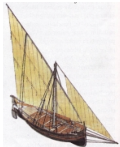
Falkuša opremljena jedrima (crtež)

U 17. stoljeću sukobljavali su se komiški ribari s ribarima iz talijanske pokrajine Apulije kojima su osporavali pravo na lov oko Palagruže. Čak je jednom došlo do sukoba u kojem su Komižani naprosto rastjerali Talijane. Sukobljavali su se i s ribarima Hvara, Korčule te susjednog Visa. Komižani su se obratili providuru Dalmacije i tek su 1808. godine tzv. Dandalovim dekretom dobili neograničeno pravo ribolova oko Palagruže, što je bila konačna potvrda njihovoga višestoljetna prava. Valja dodati da su se komiški ribari sukobljavali i s Las-