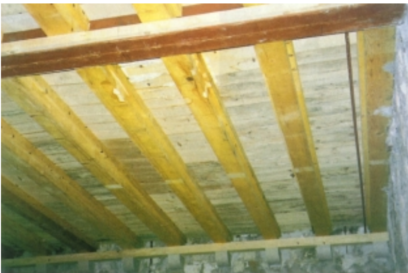
Obnovljena drvena međukatna konstrukcija

su svoj prostor stoljećima njegovali i čuvali. O uspješnosti svjedoči podatak da se na cijelo područje vratilo više od 80 posto prijašnjih stanovnika, što je više od svjetskih iskustava po kojima se na ratom stradala i poharana područja nikad ne vraća više od trećina nekadašnjeg stanovništva. Upravo taj podatak mnogo više od utrošenog novca i drugih pokazatelja, poput broja obnovljenih kuća, prostornih metara utrošenog betona ili četvornih metara krovova, najbolje ocrtava uspješnost obnove u ovom kraju.