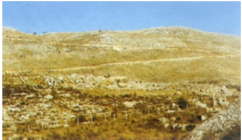
Cesta u brdima iznad Zvekovice