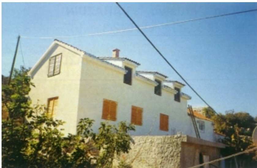
Obnovljena kuća u Trnovici (Dubrovačko primorje)

stanovnika u 22 naselja, obnova praktički potpuno dovršena, a preostalih 7 do 8 kuća nije dovršeno zbog određenih objektivnih i subjektivnih razloga. Teško je stanje u gospodarstvu. Radi jedino obnovljeni hotel Osmine u Slanom te kamenolom