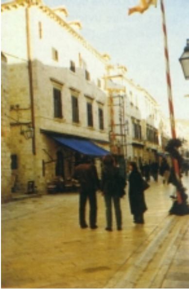
Nedovršena obnova palače na Stradunu u Dubrovniku

poslove i obnovu općine Konavle i direktorom poduzeća za obnovu Konavoski dvori d.o.o. On nas je izvijestio kako na području cijele općine treba dovršiti samo desetak građevina, a da na nekim obnovljenim zgradama preostaju tek nužni popravci, poput krovšta, prozora i sl. Devastirano i uništeno središte Čilipa jest obnovljeno, kuće su pod krovom a imaju i vanjsku stolariju. U financiranju obnove tih zgrada bez stanara, u kojima su smješteni zavičajni muzej i kulturno-umjetničko društvo, sudjelovala je i općina. Vjeruje se da će sve biti dovršeno do ljeta. Po selima je uglavnom obnova potpuno dovršena i računa se da se svojim domovima vratilo gotovo 95 posto stanovnika.