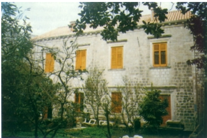
Obnovljena kuća u Konomolcu u Rijeci dubrovačkoj

Najjužniji dijelovi Hrvatske, koji se protežu od Pelješca do Prevlake, slobodno se mogu svrstati u najteže stradala područja u proteklom desetljeću, inače neobično "darežljivom" svakojakim nedaćama. Najprije je došao rat koji je većem dijelu tog područja donio privremenu okupaciju. U ratu su paljene i devastirane mnoge zgrade, posebno po konavoskim selima i naseljima Dubrovačkog primorja, a u ratnim su operacijama stradale brojne kuće te vrijedni i stari krovovi u Dubrovniku, Župi dubrovačkoj, Rijeci dubrovačkoj i na području Stona. Nedugo pošto je Hrvatska vojska uspješno oslobodila ove krajeve i pošto je uspješno tekla obnova, sjeverozapadne je dijelove ovog područja 5. rujna 1996. godine pogodio katastrofalni potres, koji je dodatno oštetio ratom stradale obnovljene i neobnovljene zgrade. No ni to još nije bilo sve jer je 1998. u požarima izgorjelo mnogo kuća u području Orebića. Taj dio Pelješca nije doduše izravno stradao u ratnim zbivanjima ili u potresu, ali je u svojim hotelima zbrinjavao prognanike i