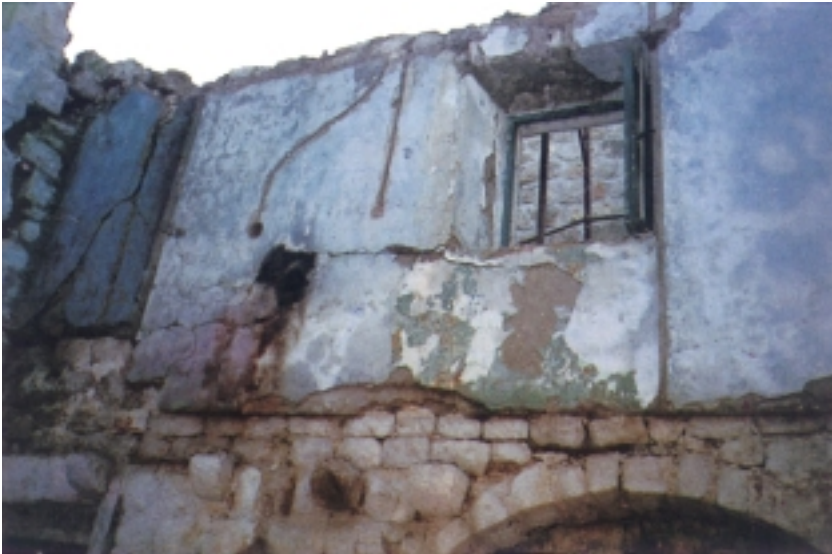
Interijer teško oštećene kuće u Slano m

središtu Konavala i Dubrovačkog primorja, a potom prema povijesnoj jezgri Dubrovnika.