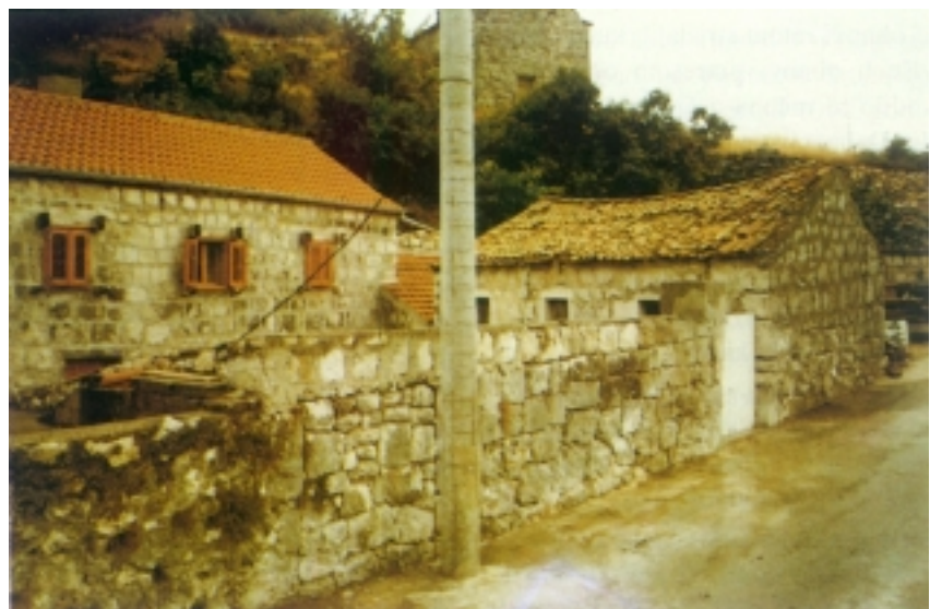
Obnovljena kuća u Majkovima (Dubrovačko primorje)